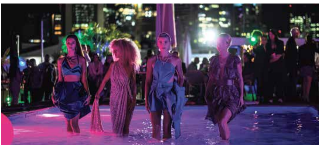
Models im kühlen Nass – in Arutti Kreationen.