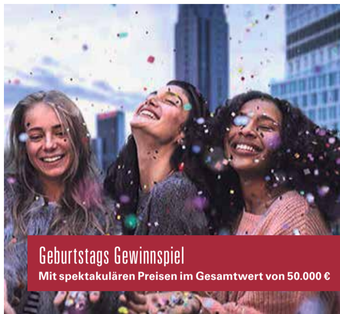
Geburtstags Gewinnspiel Mit spektakulären Preisen im Gesamtwert von 50.000 €

GALLUS (LS) | Das Skyline Plaza feiert ab 29. September 10-jähriges und bietet im Rahmen des Runden Bestehens ein munteres Geburtstagsprogramm das am Samstag an. Bis zum 7. Oktober werden Aktionen präsentiert, die mit einem großen Finale enden werden. Zum Programm, das seit Freitag läuft, gehört unter anderem die Marching Band „The Four Shops“ die bis 18:30 Uhr in der Shopping-Mall unterwegs sein wird. Nach einer kleinen Verschnaufpause am Sonntag findet am Montag von 12 bis 19 Uhr die Überraschungsaktion „Wir zahlen deinen Einkauf“ statt. Freitags kommen vor allem die „Kleinen“ auf ihre Kosten, denn von 13 bis 18 Uhr werden sogenannte „Walking Acts“ (Personen in Kostümen aus Film- und Fernsehen) unterwegs sein und die Kinder beispielsweise als Spiderman verzaubern. Am Abend gibt es dann das Programm für die nicht mehr so jungen Leute beim After Work mit Big City Beats Club Kitchen im Erdgeschoss. Von 18 bis 22 Uhr kann hier gegessen und zu guter Musik entspannt werden. Es dürfen zu diesem besonderen Geburtstag selbstverständlich keine Geschenke fehlen. Zur Teil-