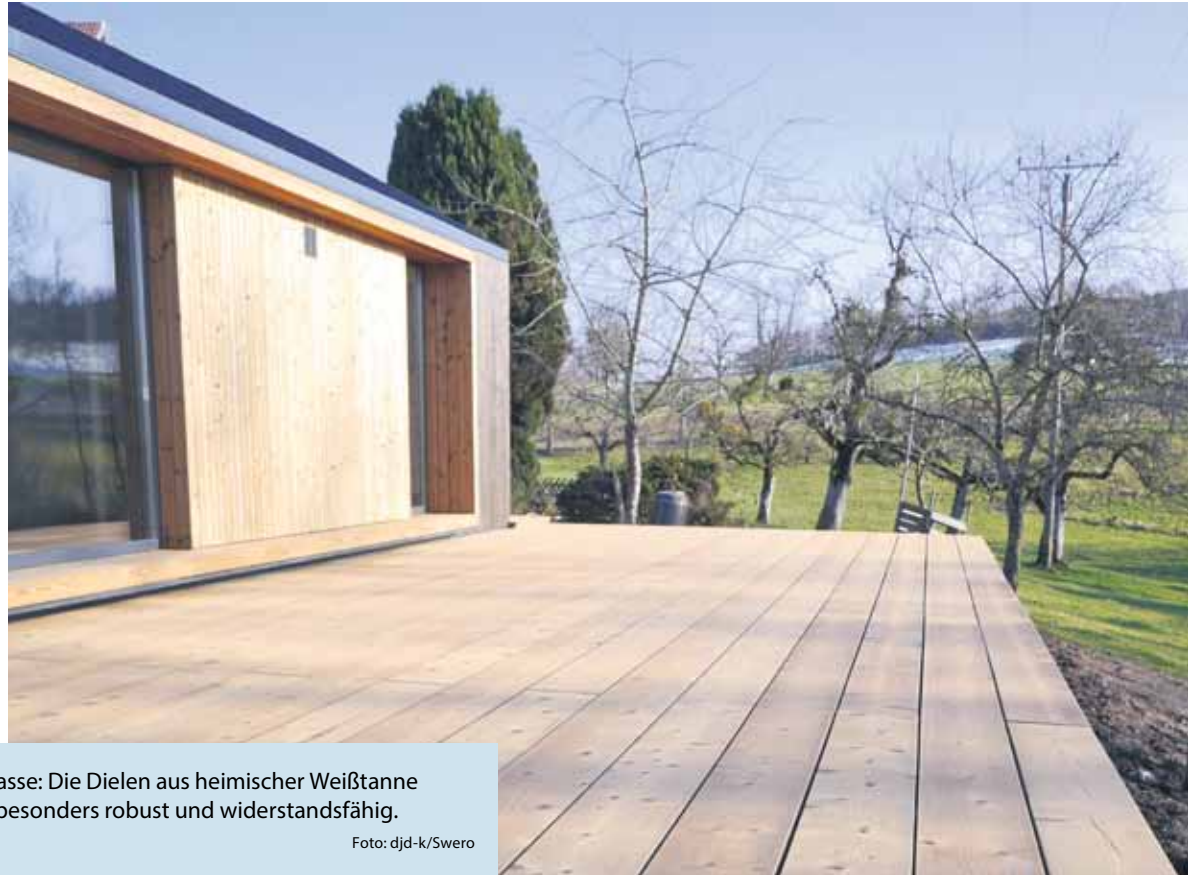
Ein natürlicher Blickfang für jede Terrasse: Die Dielen aus heimischer Weißtanne werden mit der Thermobehandlung besonders robust und widerstandsfähig.

(DJD-K). Beim nachhaltigen Bauen stehen nachwachsende Materialien wie Holz besonders im Fokus. Damit heimische Qualitäten für den Außenbereich geeignet sind, benötigen sie zuvor eine spezielle Veredelung. Bei der Thermobehandlung, wie sie in Skandinavien seit vielen Jahren üblich ist, erhält etwa heimische Weißtanne durch konstant hohe Temperaturen von bis zu 225 Grad Celsius ein neues Maß an Widerstandsfähigkeit und Robustheit. Die Rustika-Terrassendielen des Herstellers Swero zum Beispiel bieten eine gesicherte regionale Herkunft, Langlebigkeit sowie ein breites Format von 262 Millimetern für vielfältige Gestaltungsmöglichkeiten. Das Institut für Holzbiologie und Holzprodukte der Universität Göttingen hat die Widerstandskraft, die vergleichbar mit tropischen Harthölzern ist, bestätigt.