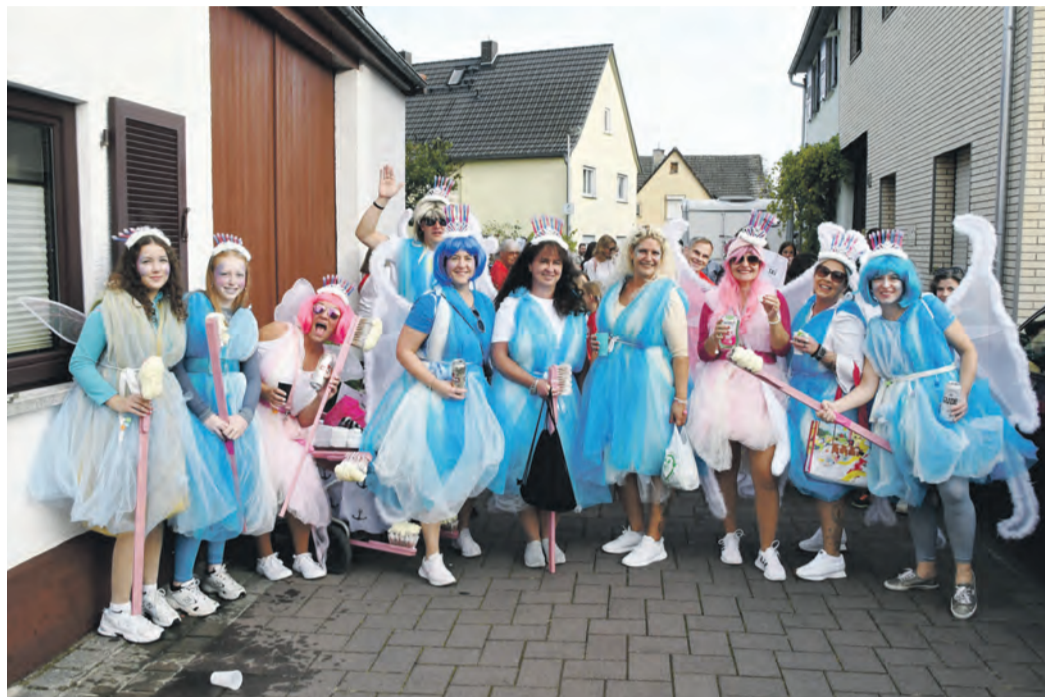
Die Fastnachtsgruppe Eppertshäuser Doschenanner lief im Zahnfee-Outfit beim Kerbumzug mit.