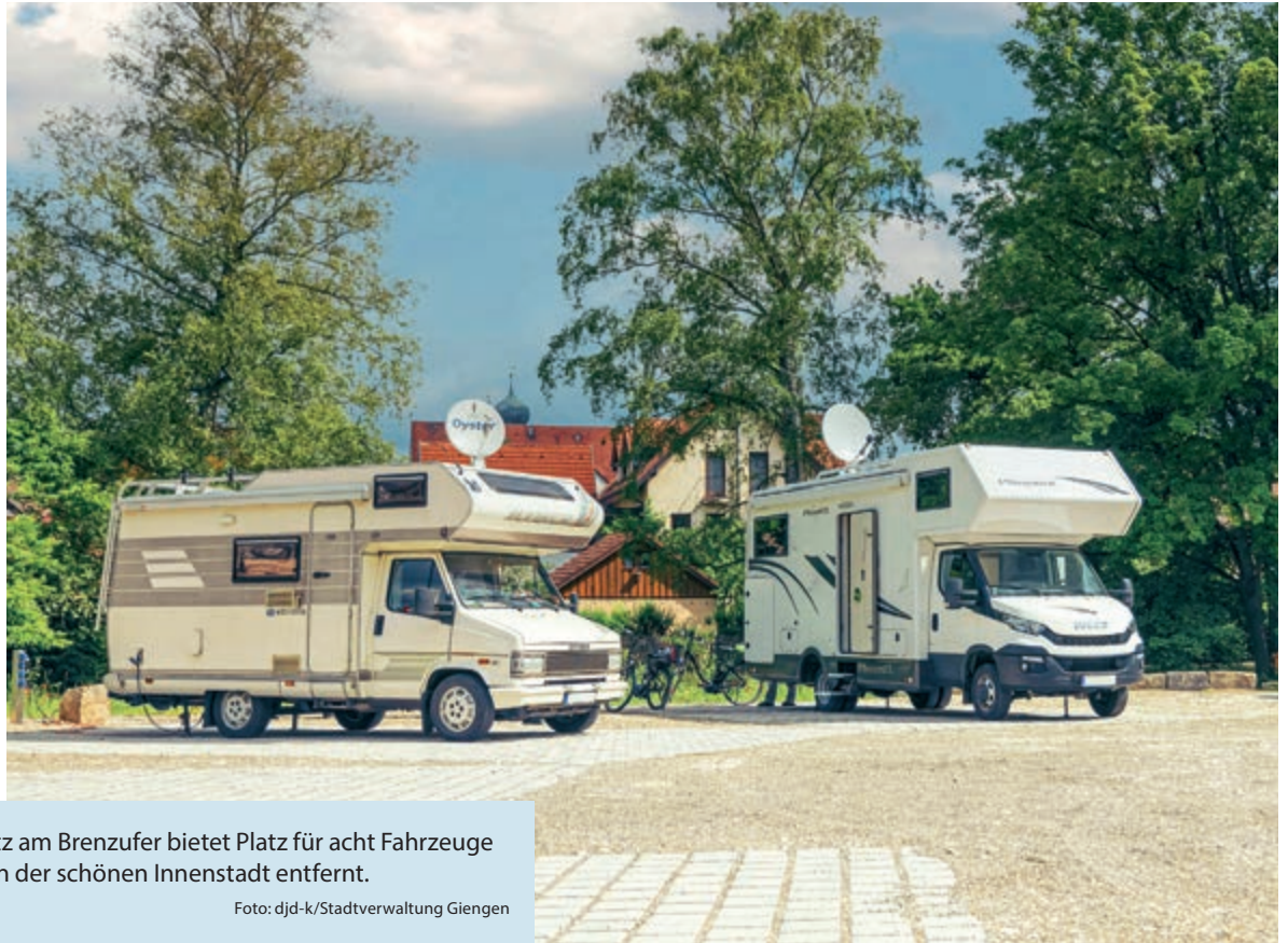
Der vollversorgte Wohnmobilstellplatz am Brenzufer bietet Platz für acht Fahrzeuge und liegt nur wenige Gehminuten von der schönen Innenstadt entfernt.

(DJD-K). Schätzungen zufolge betreiben hierzulande etwa zehn Millionen Menschen zumindest gelegentlich Camping oder Caravaning. Wohnmobilisten schätzen die Nähe der Stellplätze zur Natur und die Flexibilität bei der Reiseplanung. Ein spannendes Ziel für Individualurlauber ist Giengen an der Brenz. Nur wenige Schritte von der schmucken Innenstadt entfernt kann man sein Fahrzeug am Ufer der Brenz parken. Der vollversorgte Stellplatz bietet Platz für acht Wohnmobile und kostet sechs Euro pro Übernachtung, hinzu kommen geringfügige Kosten für Strom und Wasser. Mehr Infos: www.giengen.de . Nicht versäumen sollte man in Giengen einen Besuch im Steiff Museum, eine Wanderung auf dem Holzskulpturenpfad inklusive Abenteuer mit dem Einhorn Panschi, die Charlottenhöhle und die restaurierte Alte Mühle.