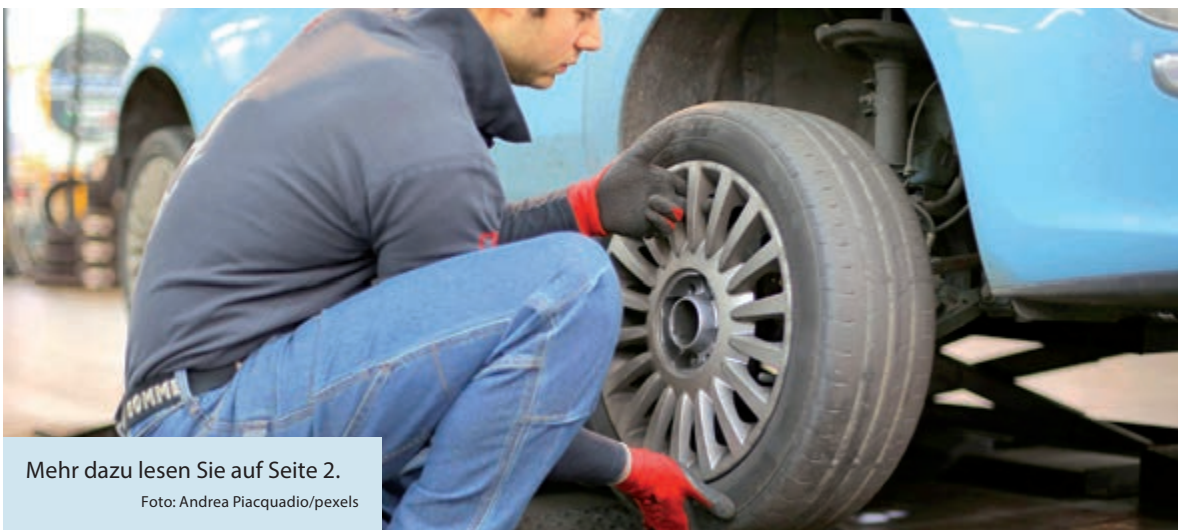
Mehr dazu lesen Sie auf Seite 2.