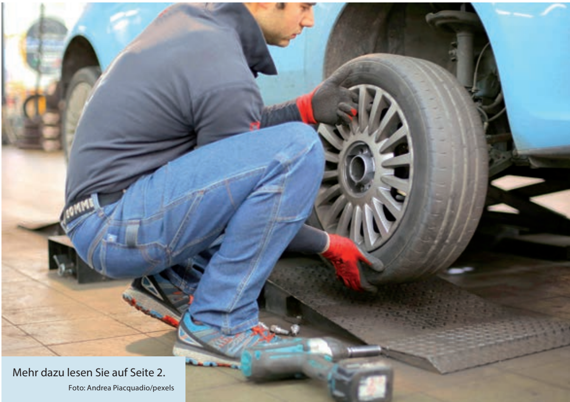
Mehr dazu lesen Sie auf Seite 2.