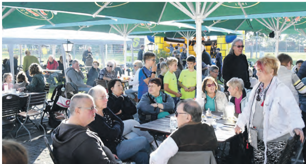
Der TSV-Biergarten (hier bei der Kerb 2021) wird auch in diesem Jahr wieder zweiter wichtiger Schauplatz der Altheimer Kerb neben dem Außenbereich des Feuerwehr-Hauses sein.

Kerbantrinken an der Feuerwehr statt, das die Brandschützer auch selbst organisieren. An selber Stelle geht es am Samstag ab 14 Uhr los, einschließlich Getränkeverkauf durch die Eintracht-Fans. Auch ein kleiner Rummelplatz, den die Gemeinde Münster organisiert, wird dann am Feuerwehr-Haus zu finden sein. Dort ist einer von zwei Hotspots der Altheimer Kerb. Der zweite befindet sich am Ortsrand im Biergarten