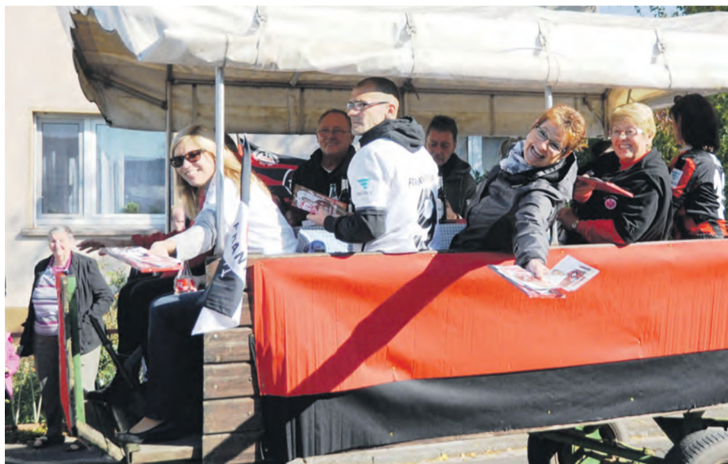
Ein Foto, wie es in diesem Jahr nicht entstehen wird: Ein Wagen - hier jener des Eintracht-Fanclubs, der 2023 der Ausrichter ist - fährt beim Altheimer Kerbumzug mit. Der EFC hat sich zur Absage des Umzugs entschlossen. Gefeierte werden vom 13. bis 16. Oktober dennoch.

Schon dieser Zwiespalt habe die Entscheidung gen Absage des gesamten Altheimer Kerbumzugs vorgegeben, so Damm. „Wenn wir den Umzug ohne Wagen durchgeführt hätten, wären etliche Teilnehmer weggefallen“, glaubt er. Weitere Aspekte hätten den EFC in seinem Entschluss bestärkt: „Auf jedem Wagen hätte zum Beispiel ein Feuerlöscher vorgehalten werden müssen. Auch für die Einhaltung solcher Vorgaben hätten wir nicht garantieren können. Wer das Risiko, einen Umzug trotzdem durchzuführen, noch auf sich nimmt: Gut! Wir können es aber nicht mehr. Als kleiner Verein können wir die Haftung für so etwas nicht übernehmen.“