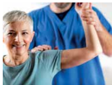
Diagnosefindung Osteoporose.

Bewegung beugt einer Osteoporose vor und unterstützt die Therapie nach erfolgter Diagnose. 3 Sportarten wie Nordic Walking, Gymnastik oder Krafttraining kräftigen die Muskeln und trainieren den Gleichgewichtssinn. 4 Eine kalziumreiche Ernährung und eine ausreichende Versorgung mit Vitamin D runden die Präventionsmaßnahmen ab und sind auch bei einer bestehenden Osteoporose Teil der Behandlung. 5,6