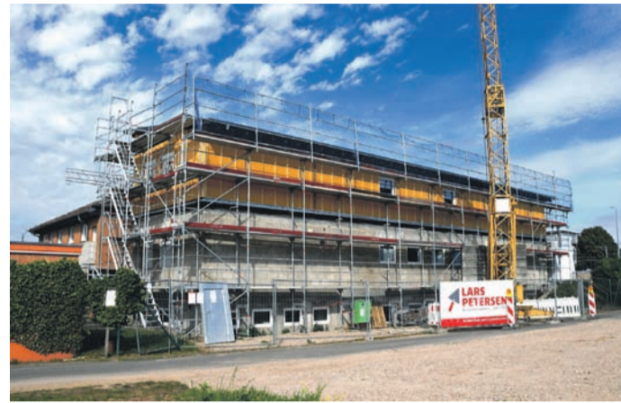
Das neue Betriebsgebäude der Münsterer Kläranlage wächst bereits in die Höhe. Nun aber der Kostenschock: Statt 1,2 wird es 2,2 Millionen Euro teuer. Dies dürfte auch zu höheren Abwassergebühren führen.