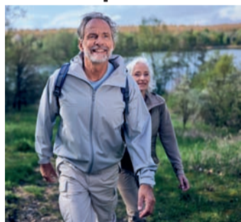
gung sollte jedoch an das individuelle Fitness- und Beweglichkeitslevel angepasst werden. Bei Unsicherheiten ist es immer sinnvoll, mit einem Arzt/einer Ärztin, einem/r Physiotherapeut:in oder einem/r Fitness-trainer:in zu sprechen.

Spielen mit den Enkel:innen, mit dem Fahrrad zum Einkaufen fahren und der Haus- oder Gartenarbeit nachgehen – auch für Senior:innen machbar, oder? Mit zunehmendem Alter wird Bewegung immer wichtiger, um agil zu bleiben. Selbst wenn ein aktiver Lebensstil bisher nicht so sehr im Fokus stand, lautet die gute Nachricht: Es ist nie zu spät, um damit anzufangen. Egal ob Treppensteigen, Staubwischen, Spaziergänge mit dem Hund oder auch Sport, all das unterstützt die Gelenkgesundheit.