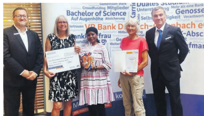
Der TAV wurde für sein außerordentliches gesellschaftliches Engagement ausgezeichnet.