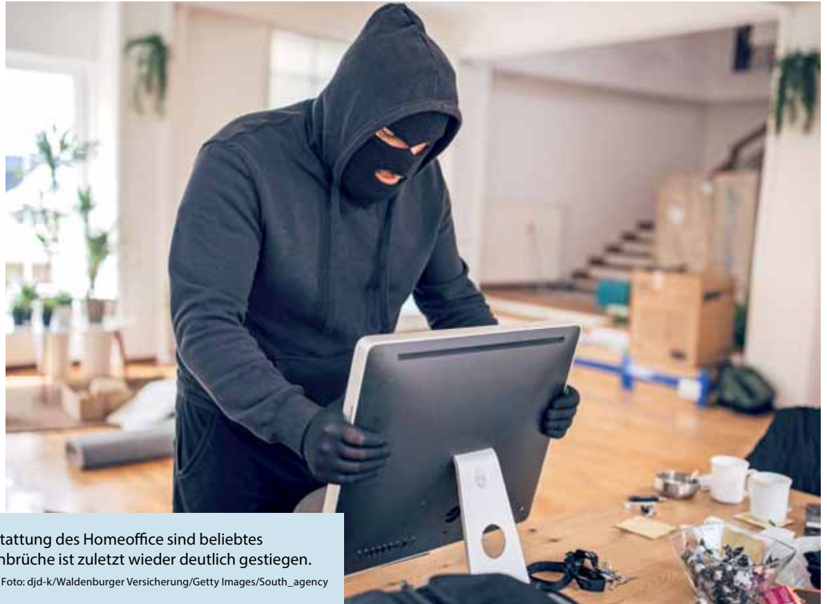
Wertsachen, Schmuck sowie die Ausstattung des Homeoffice sind beliebtes Diebesgut. Die Zahl der Wohnungseinbrüche ist zuletzt wieder deutlich gestiegen.

(DJD-K). Nach Jahren mit rückläufigen Zahlen berichten mehrere Bundesländer für 2022 über eine deutliche Zunahme der Wohnungseinbrüche. Ein Grund könnte sein, dass viele wieder am regulären Arbeitsplatz statt im Homeoffice arbeiten und die Aufenthaltszeit in der eigenen Wohnung oder dem Eigenheim generell gesunken ist. Zur Vorsorge sollte man daher regelmäßig den Schutz der Hausratversicherung überprüfen und bei Bedarf anpassen, um eine Unterversicherung zu vermeiden. Unter www.waldenburger.com etwa gibt es dazu mehr Informationen und einen interaktiven Rechner für den persönlichen Versicherungsbedarf. Eine Besonderheit weist der „Premium Plus“-Tarif auf, denn hier sind Schäden bis zu 5.000 Euro in Folge einer polizeilich angezeigten Straftat mitversichert.