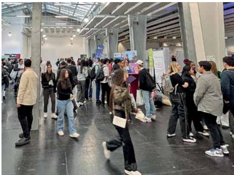
An zwei Tagen informierten sich junge Menschen, teilweise in Begleitung ihrer Eltern, auf der Bildungsmesse Offenbach über die Ausbildungsmöglichkeiten, die es in der Region gibt.