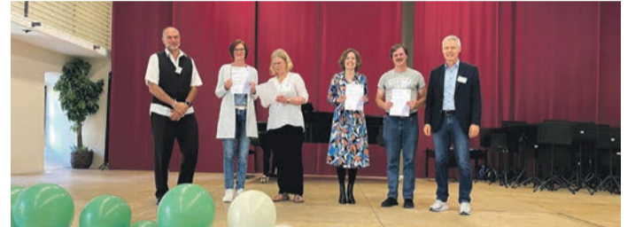
Übergabe des Zertifikats.

Während der gesamten Dauer der Baumaßnahmen kommt es zu kleinen Einschränkungen für den Fuß- und Radverkehr. Im Anschluss der Arbeiten wird der Weg teilweise saniert. Hierfür erfolgt eine Vollsperrung in der Zeit von Montag, 23. Oktober bis Freitag, 27. Oktober.