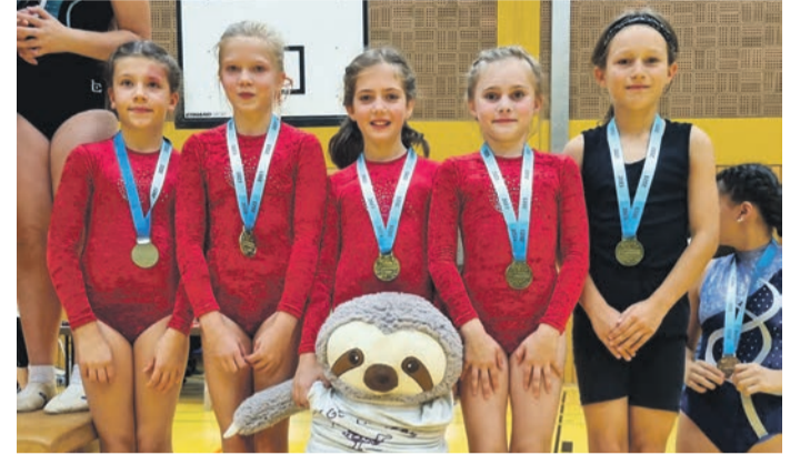
83 Nachwuchsteams nahmen am TUJU-Mannschaftswettkampf teil. Das Sloth Mixed-Team der TGS Hausen (Bild rechts) holte dabei Bronze.