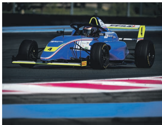
Starke Aufholjagd in allen Rennen.

Saisonfinale der französischen Formel 4 in Paul Ricard