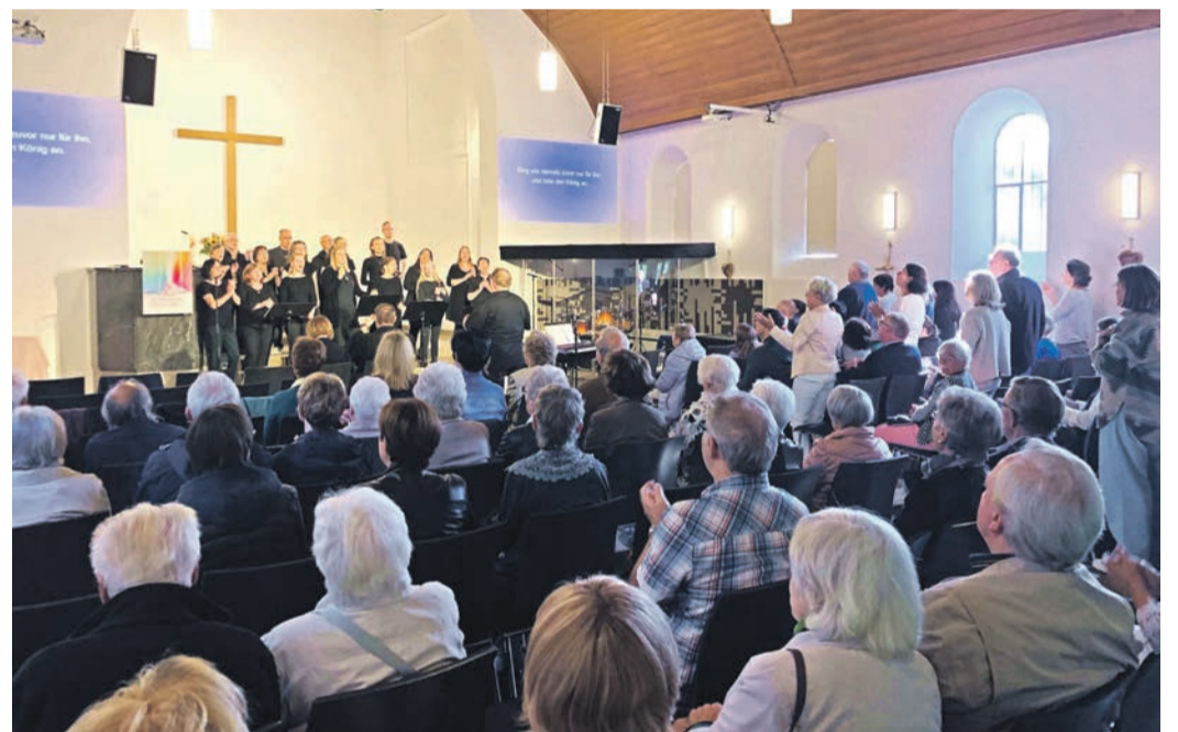
Festgottesdienst in der Waldkirche.

gaben. Beim Empfang wurde auch eine neue „Zeitkapsel“ vorgestellt, in dem zukünftig die Urkunden zum Bau des Gemeindehauses 1977 und des Erweiterungsbaus 2015 für die „Nachwelt“ aufbewahrt werden.