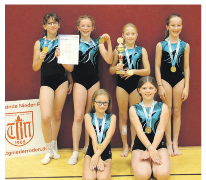
Die P3-P4- Mannschaft der TGN holte Gold.