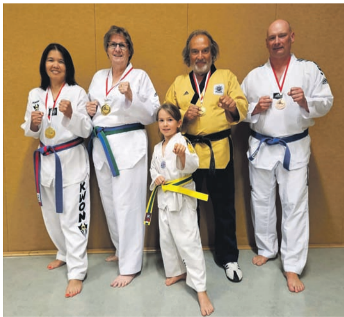
Unter den rund 240 Teilnehmenden aus fünf Bundesländern und 27 Vereinen gingen auch fünf Taekwondoler der SG Hainhausen an den Start.