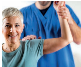
Diagnosefindung Osteoporose.

Bewegung beugt einer Osteoporose vor und unterstützt die Therapie nach erfolgter Diagnose. 3 Sportarten wie Nordic Walking, Gymnastik oder Krafttraining kräftigen die Muskeln und trainieren den Gleichgewichtssinn. 4 Eine kalziumreiche Ernährung und eine ausreichende Versorgung mit Vitamin D runden die Präventionsmaßnahmen ab und sind auch bei einer bestehenden Osteoporose Teil der Behandlung. 5,6