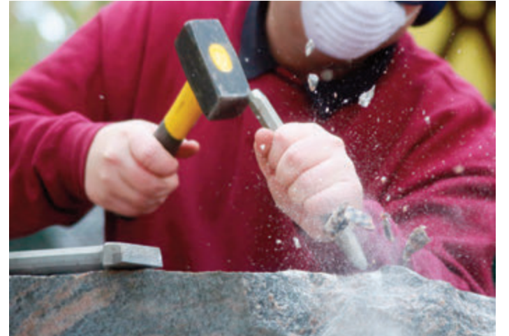
Steinmetz bei der Arbeit.