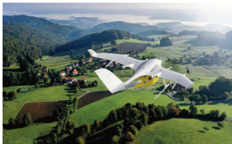
So könnte demnächst der Einkauf zu den Odenwäldern kommen.

Zur Auswahl steht anfangs ein breites Produktangebot des örtlichen Rewe-Markts. Weitere lokale Einzelhändler sollen im Verlauf des Projekts zur Platt-