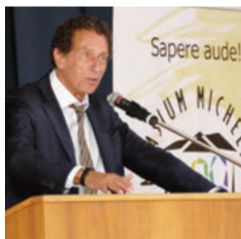
Prof. Dr. Dr. hc Julian Nida-Rümelin bei der Rede zum Jubiläum.