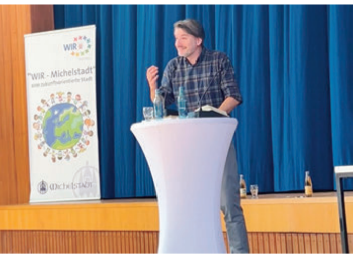
Sasa Stanisic bei der Lesung.