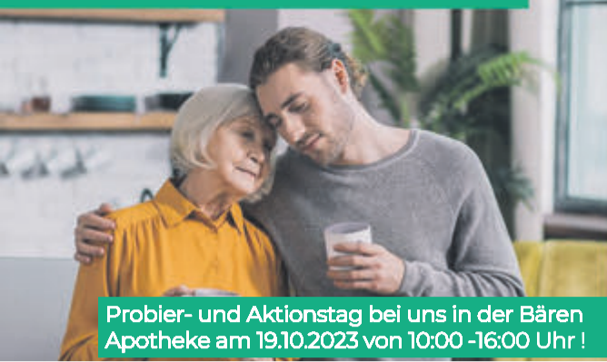
Probier- und Aktionstag bei uns in der Bären Apotheke am 19.10.2023 von 10:00 -16:00 Uhr!

Entdecken Sie Geschmack nach Maß am 19.10.2023 in Ihrer Bären Apotheke!