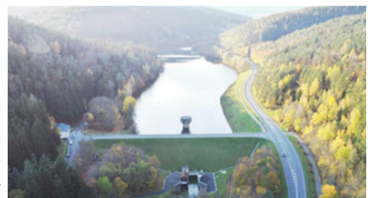
Ein Blick von Oben auf die Marbachtalsperre.