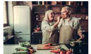
Vitamine sind wichtig – auch im Alter.

Dass eine abwechslungsreiche, ausgewogene Ernährung wichtig für die Gesundheit ist, weiß im Grunde jeder. Und doch ist laut einer repräsentativen Studie jeder Vierte über 65 Jahren nicht ausreichend mit Vitamin B12 versorgt. 1 Die Gründe dafür sind vielfältig: Da sich der Geschmacks- und Geruchssinn im Laufe des Lebens verändern, haben viele Menschen mit den Jahren weniger Appetit oder werden schneller satt. Dazu kommt, dass auch bestimmte Erkrankungen und Medikamente die Aufnahme von Vitaminen in den Körper beeinträchtigen können. So verbreitet er jedoch auch ist: Oft fällt ein Mehrbedarf an B-Vitaminen gar nicht auf – und das kann sich auf Dauer z. B. auf die geistige Leistung 2 auswirken oder sich in Form von Müdigkeit und Antriebslosigkeit bemerkbar machen. Die 8 B-Vitamine sorgen im Körper für Energie 3 und Konzentration 2 . Dabei er-