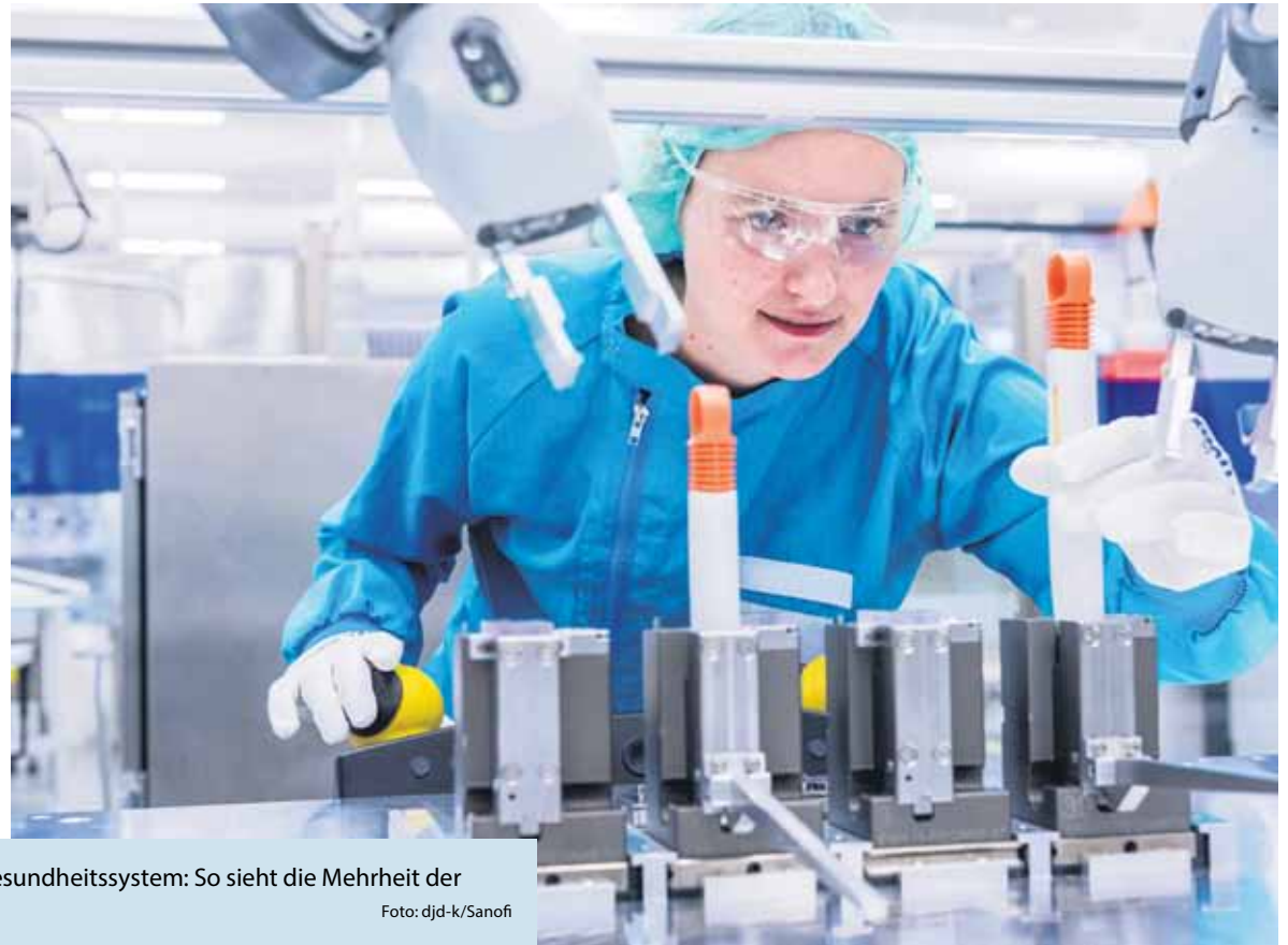
Wichtig für die Wirtschaft und das Gesundheitssystem: So sieht die Mehrheit der Deutschen die Pharmaindustrie.

(DJD-K). Wie bedeutend die Erforschung und Produktion von Arzneimitteln für das eigene Leben sein kann, merkt man, wenn man selbst auf Medikamente angewiesen ist oder Freunde und Familienmitglieder diese benötigen. Tatsächlich ist den meisten Menschen im Land die wichtige Rolle der Pharmaindustrie für die Gesundheitsversorgung in Deutschland sehr bewusst: Laut dem Sanofi Gesundheitstrend finden 89 Prozent, dass die Branche für den Gesundheitsstandort Deutschland wichtig ist. 87 Prozent meinen, dass die Produktion von Arzneimittelwirkstoffen nicht nur in Asien erfolgen sollte. Und vier von fünf Befragten sehen die Pharmaindustrie als innovativ an, etwa bei der Entwicklung neuer Therapien und Impfstoffe, in der auch das Gesundheitsunternehmen Sanofi aktiv ist – mehr unter www.sanofi.de .