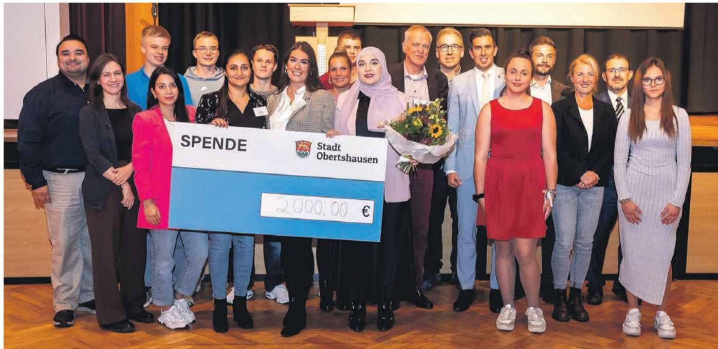
Einer der drei Preisträger war die Hermann-Hesse-Schule für ihre zahlreiche sozialen Projekte.