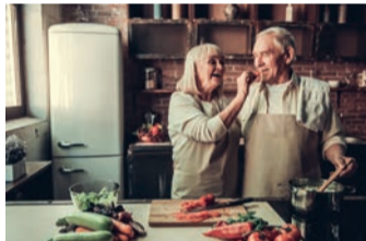
Vitamine sind wichtig – auch im Alter.

Das eine abwechslungsreiche, ausgewogene Ernährung wichtig für die Gesundheit ist, weiß im Grunde jeder. Und doch ist laut einer repräsentativen Studie jeder Vierte über 65 Jahren nicht ausreichend mit Vitamin B12 versorgt. 1 Die Gründe dafür sind vielfältig: Da sich der Geschmacks- und Geruchssinn im Laufe des Lebens verändern, haben viele Menschen mit den Jahren weniger Appetit und werden schneller satt. Dazu kommt, dass auch bestimmte Erkrankungen und Medikamente die Aufnahme von Vitaminen in den Körper beeinträchtigen können. So verbreitet er jedoch auch ist: Oft fällt ein Mehrbedarf an B-Vitaminen gar nicht auf – und das kann sich auf Dauer z. B. auf die geistige Leistung 2 auswirken oder sich in Form von Müdigkeit und Antriebslosigkeit bemerkbar machen. Die 8 B-Vitamine sorgen im Körper für Energie 3 und Konzentration 2 . Dabei er-