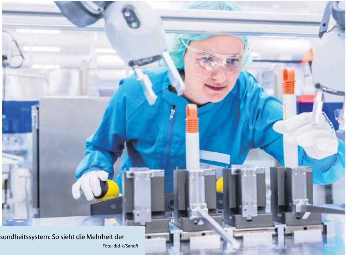
Wichtig für die Wirtschaft und das Gesundheitssystem: So sieht die Mehrheit der Deutschen die Pharmaindustrie.

(DJD-K). Wie bedeutend die Erforschung und Produktion von Arzneimitteln für das eigene Leben sein kann, merkt man, wenn man selbst auf Medikamente angewiesen ist oder Freunde und Familienmitglieder diese benötigen. Tatsächlich ist den meisten Menschen im Land die wichtige Rolle der Pharmaindustrie für die Gesundheitsversorgung in Deutschland sehr bewusst: Laut dem Sanofi Gesundheitstrend finden 89 Prozent, dass die Branche für den Gesundheitsstandort Deutschland wichtig ist. 87 Prozent meinen, dass die Produktion von Arzneimittelwirkstoffen nicht nur in Asien erfolgen sollte. Und vier von fünf Befragten sehen die Pharmaindustrie als innovativ an, etwa bei der Entwicklung neuer Therapien und Impfstoffe, in der auch das Gesundheitsunternehmen Sanofi aktiv ist – mehr unter www.sanofi.de .