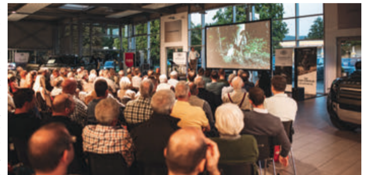
Viel Informatives gab es für Jagdinteressierte beim Autohaus Böhm.

Die Land Rover Live-Vortragsreihe wird im nächsten Jahr fortgesetzt.