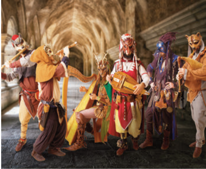
Die Kostüme der Gruppe „In Vino Veritas“ stimmen ebenso auf die märchenhaften Tage in Reichelsheim ein wie ihre Musik.

Das diesjährige Motto „Die Bremer Stadtmusikanten – was Besseres als den Tod findet man überall“ hält so manche Überraschung bereit. Es gibt selbstgebackene Lebkuchen, Plätzchen, an beiden Tagen die neuen Modetrends und Wolltrends, auch Lederwaren, Gewürze, Kräuterbonbons und Bienenprodukte bieten die Aussteller an. Diverse Kunsthandwerker sind natürlich auch wieder mit dabei. Gartendeko, Dekorationen aus Holz, Makramee und Filz, Glücksbringer, Schmuck, Feder-schmuck, Irisfotos, selbstgemachte Marmeladen und Essige, selbstgenähte Kleinigkeiten, Ba-