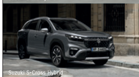
Suzuki S-Cross Hybrid