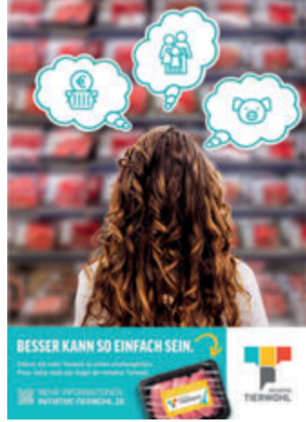
1 AOK-Familienstudie 2 Bundesamt für Statistik 3 PwC

ist die richtige Wahl. Der gesunde und tierfreundliche Einkauf ist schnell erledigt. So entlastet das Label im Alltag. Unkompliziert und bezahlbar. Besser kann so einfach sein.