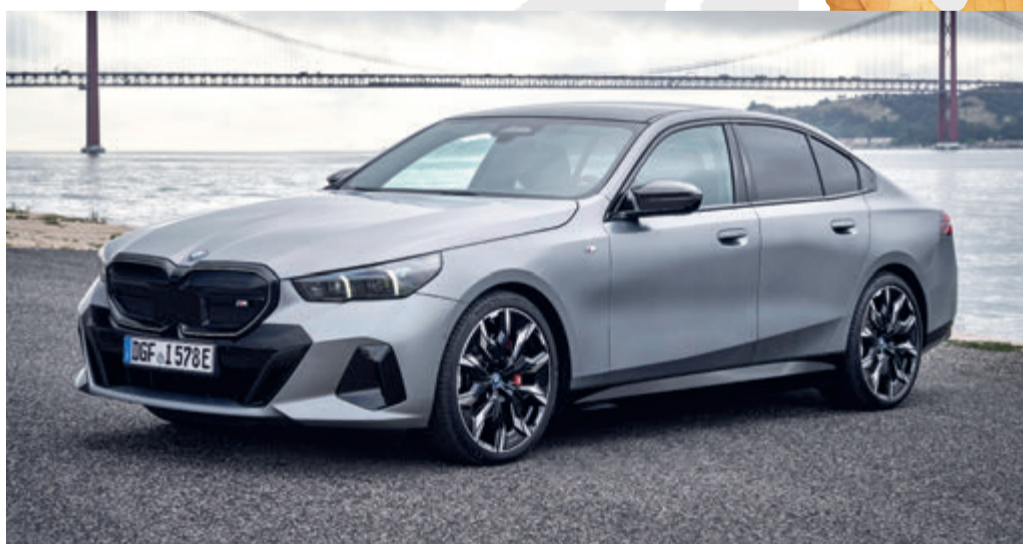
Foto: Der BMW i5 M60 xDrive - Still

Ein Highlight ist das Assistenzsystem, das mit der Erlaubnis des Kraftfahrt-Bundesamts dauerhaft Tempo, Spur und Abstand regeln darf. Auf langen Autobahnstrecken kann das Fahrzeug nun fast freihändig gefahren werden, solange der Blick auf die Straße gerichtet bleibt. Dies wird durch die Fahrerüberwachung per Kamera gewährleistet. Die Assistenzsysteme können so auch selbstständig überholen: Ein entschiedener Blick in den Spiegel reicht, und der Wagen setzt zum Überholen an.