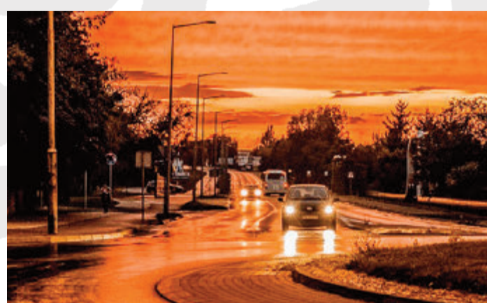
In der Dämmerung muss unbedingt das Licht eingeschaltet werden.

Zeller Gewerbezentrum 22 64732 Bad König Tel. +49 6063 95950, http://www.autohaus-voegler.de