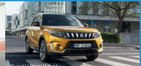
Suzuki Vitara Hybrid