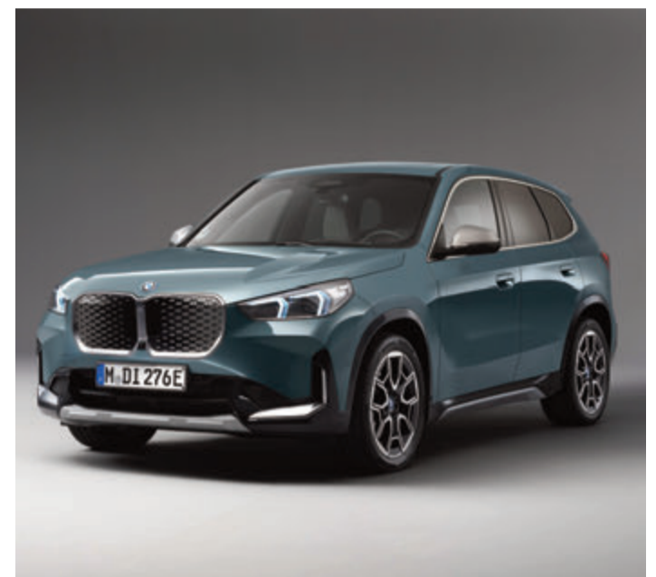
Der neue BMW iX1 eDrive20.

Im Fahrverhalten zeigt sich der kompakte SUV in Kurven sicher und stabil. Mit schnellen Ladeleistungen und einem Energiesparmodus durch Rekuperation kann das Fahrzeug auch über längere Strecken ohne langes Laden genutzt werden.