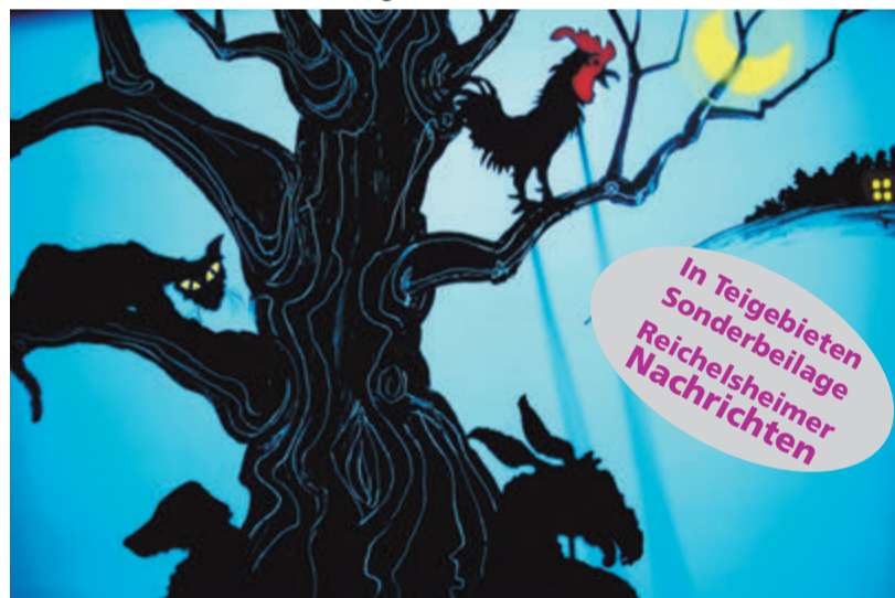
Hahn und Hund, Katze und Esel – die Bremer Stadtmusikanten stehen im Mittelpunkt der Reichelsheimer Märchen- und Sagentage.