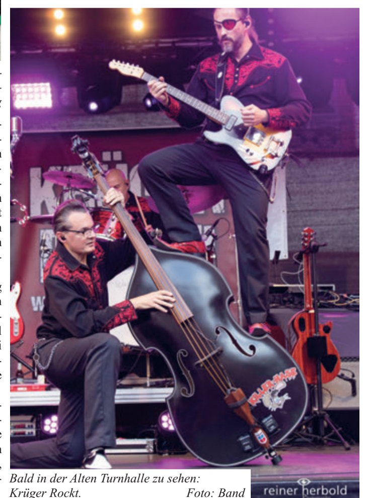
Bald in der Alten Turnhalle zu sehen: Krüger Rockt.

Oberzent. Der Verein Generation Oberzent hat die deutschlandweit tourende Band „Krüger rockt“ für Samstag, 28. Oktober, in die Alte Turnhalle in Oberzent-Beerfelden eingeladen. Ab 18 Uhr ist die Halle geöffnet, um 20 Uhr geht das Konzert los. Karten gibt es im Vorverkauf zum Preis von 20 Euro, an der Abendkasse 24 Euro. Teilnehmer eine Mail an info@odw-journal.de mit dem Betreff „Krüger rockt“ und den Schreibwaren Lenz“ können Karten ebenso gekauft werden wie direkt beim Verein unter: red.karten@generation-oberzent.de oder unter Tel.: 0176-52325200. Beim Verein wird auf Rechnung mit zwei Euro Versandgebühr gekauft. Das Odenwälder Journal verlost drei mal zwei Karten unter den Leserinnen und Lesern. Bis Dienstag, 24. Oktober, schicken Teilnehmer eine Mail an info@odw-journal.de mit dem Betreff „Krüger rockt“ und den Kontaktdaten. Der Rechtsweg ist bei der Verlosung ausgeschlossen.