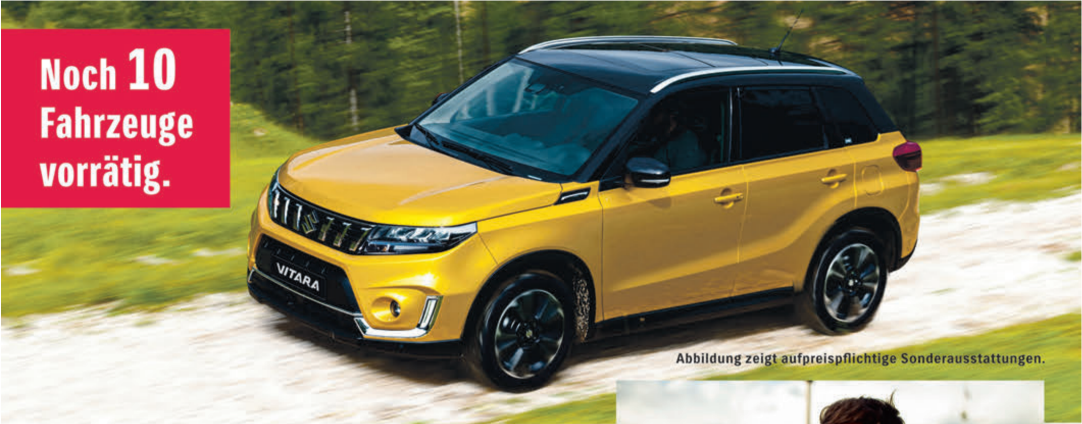
Abbildung zeigt aufpreispflichtige Sonderausstattungen.

Aktionspreis für Suzuki Vitara 1.5 DUALJET HYBRID ALLGRIP AGS Automatik COMFORT. Tageszulassung 08.2023 | 80 km.