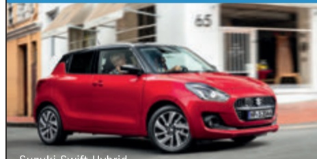
Suzuki Swift Hybrid

Jetzt 250 EUR* sichern. Die Suzuki Probefahrtwochen.