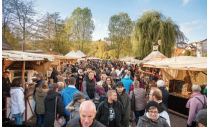
So abwechslungsreich und bunt soll es wieder werden.