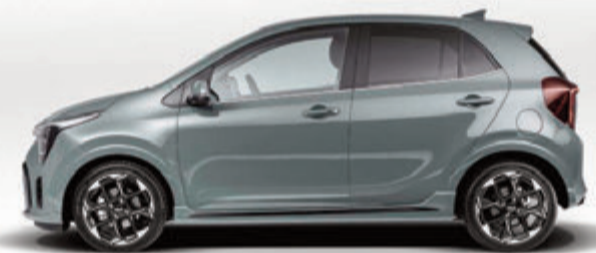
Kaum zu glauben, was alles in unseren Kleinsten passt: noch mehr Style, noch mehr Top-Technologie und dynamischer Fahrspaß vom Feinsten.

Trotz der engen Platzverhältnisse ist auf der Rückbank des Picanto noch genug Platz auch für größere Mitfahrer. Eng um die Knie wird es nur dann, wenn bereits auf dem Vordersitz eine größere Person Platz nimmt.