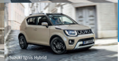
Suzuki Ignis Hybrid

Abbildungen zeigen aufpreispflichtige Sonderausstattung.