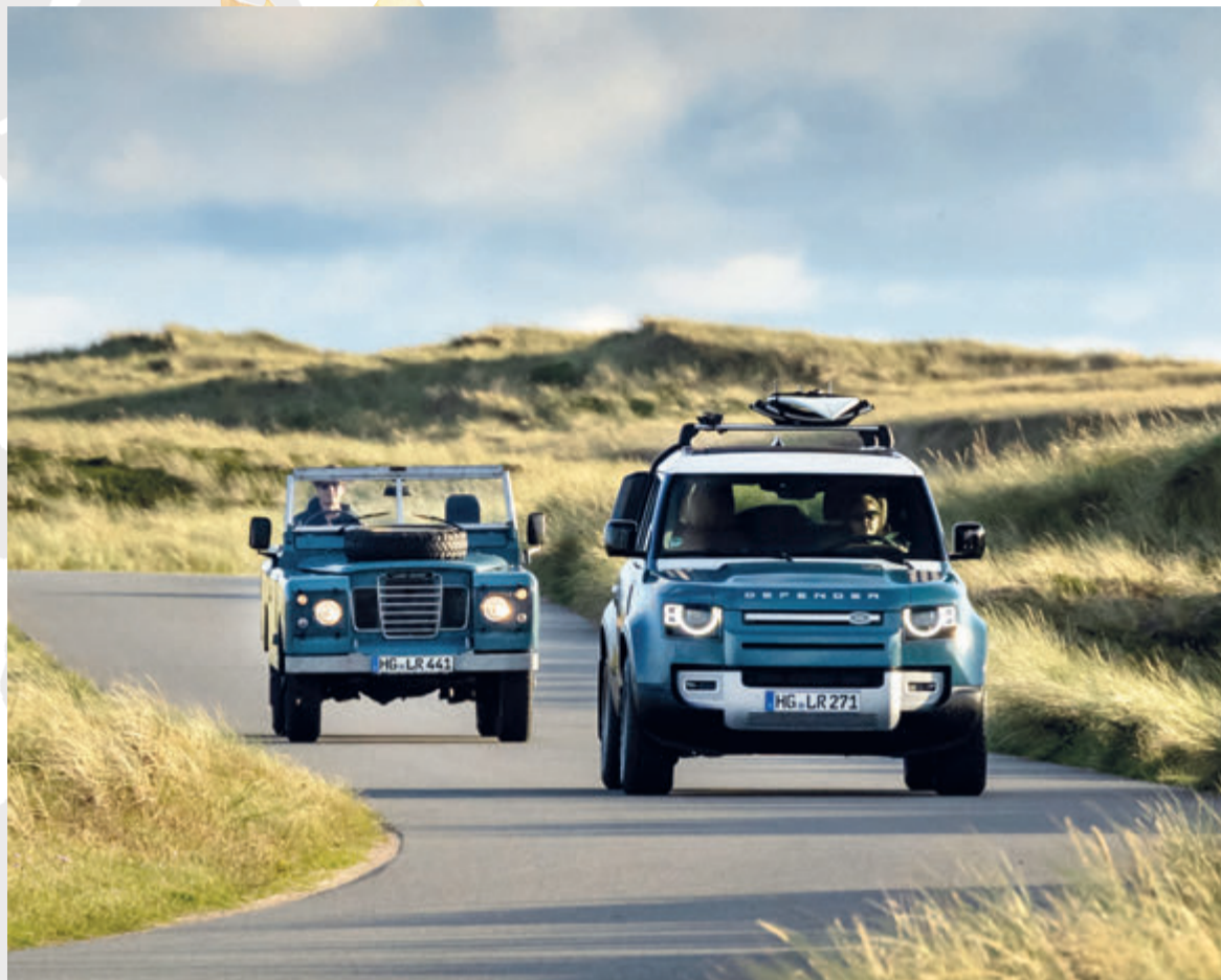
DEFENDER 90 D250 AWD MARINE BLUE EDITION