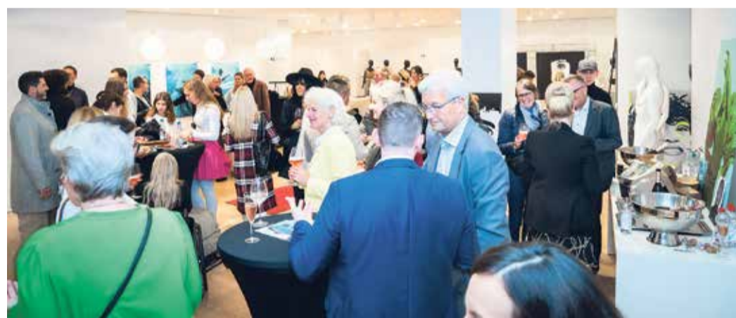
Impressionen von der Veranstaltung.