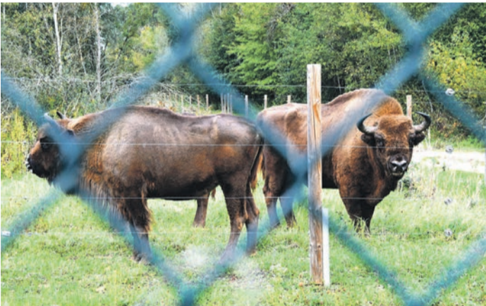
Der Naturerlebnispfad am Urberacher Weg und die Aussichtsplattform auf dem Muna-Gelände nahe dem Münsterer Ortsteil Breitefeld sind am Dienstag eröffnet worden. Auch die Wisente waren zu sehen.

in den vergangenen Monaten eindrucksvoll mit Bildern von Wisenten und Wildpferden besprüht. In einem der Ex-Bunker hat er sie dreidimensional inszeniert, was sich besonders gut von einem markierten Betrachtungspunkt aus erschließt. Auf der Plattform selbst bleibt es auch dann spannend, sollten Besucher weder mit bloßem Auge noch durch die installierten Fernrohre die in freier Wildbahn seltenen Wisente und Wildpferde entdecken. Eine große Tafel klärt über einzelne Biotope der ökologisch wertvollen, weil vom Menschen seit Jahrzehnten zwangsweise unberührten Fläche auf, die der Panorama-Blick freigibt. Außerdem können Gäste nach dem kurzen, barrierefreien Aufstieg auf einem Barfußpfad laufen, Tier-silhouetten entdecken und ein „Naturmemory“ spielen. Das hinter den Kulissen entstandene ökologische Ausgleichsprojekt der Deutschen Bahn für die geplante Schnellstrecke von Frankfurt nach Mannheim hinterließ am Dienstag einen durchdachten und hochwertigen ersten Eindruck.