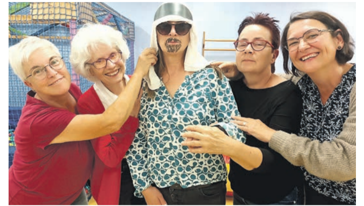
Turbulente Komödien sind das Markenzeichen von Spectaculum. In diesem Jahr mischt dabei ein Scheich kräftig mit.