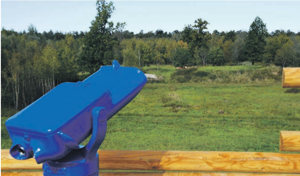
Von der am Dienstag vergangener Woche eröffneten Aussichtsplattform kann man über einen Teil des 260 Hektar großen Muna-Biotops schauen - und mit etwas Glück auch die Wildpferde (klein hinten in der Bildmitte zu erkennen) entdecken.

Münster (jedö) Der Ostkreis Darmstadt-Dieburg hat eine neue Attraktion: Am Dienstag haben die Deutsche Bahn (DB), der in der Bundesanstalt für Immobilienaufgaben (BImA) eingegliederte Bundesforst und die Gemeinde Münster ein Ensemble auf und am Muna-Gelände eingeweiht, das in dieser Form bundesweit einzigartig ist. Am Urberacher Weg nahe dem Münsterer Ortsteil Breitefeld ist - jederzeit öffentlich zugänglich - der „Naturerlebnispfad Wisentwald“ entstanden. Er führt bis zum Tor des abgesperrten Areals der ehemals von den Nazis und später von den Amerikanern genutzten Munitionsanstalt, wo zu bestimmten Öffnungszeiten weitere Stationen des Umweltbildungsprojekts besucht werden können. Prunkstück ist eine Aussichtsplattform, die den Weitblick über 260 Hektar große Biotop ermöglicht. Mit etwas Glück entdeckt man dort auch die in den vergangenen Jahren angesiedelten Wisente und Wildpferde. Am Dienstag war das der Fall. Relativ nah kommen konnten die Besucher bei der Einweihung am frühen Nachmittag besonders der Wisentherde. Von den Rindern gibt es in der Muna derzeit 14 Exemplare. Fünf sind dort zur Welt gekommen.