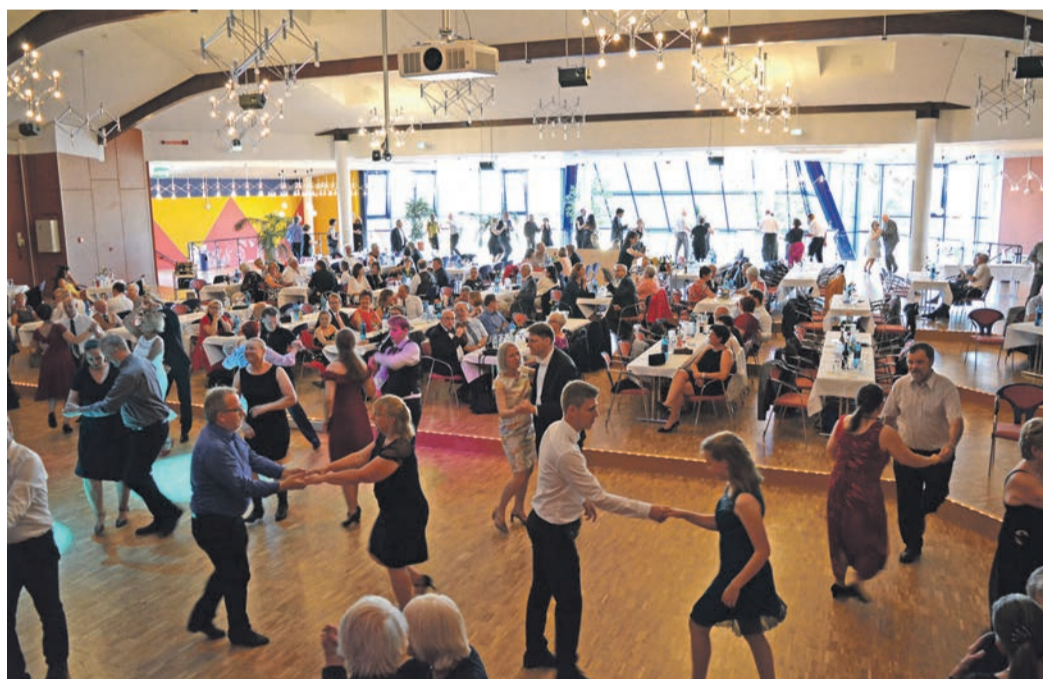
Münster ist wieder im Tanzfieber! Neben dem Herbstball am 4. November nahen im Herbst noch weitere Kultur-Highlights.

Kunstaussstellung an fünf Sonntagen plus Special-Events Ebenfalls in den Startlöchern steht die vierwöchige Ausstellung „Kunst in der Mühle“, bei der auch dieses Jahr wieder in Münsters ältestem Gebäude, der alten Mühle in der Bahnhofstraße 48, Werke örtlicher Kunstschaffender gezeigt werden. Die Vernissage findet am Sonntag, 5. November von 14 bis 17 Uhr statt. An den dar-