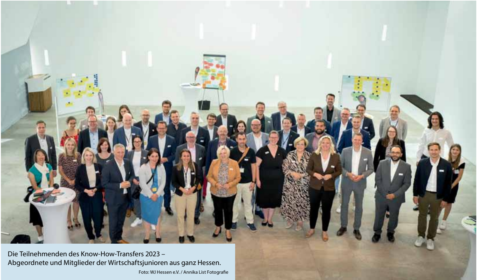
Die Teilnehmenden des Know-How-Transfers 2023 – Abgeordnete und Mitglieder der Wirtschaftsunioren aus ganz Hessen.