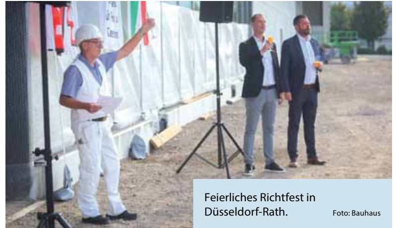
Feierliches Richtfest in Düsseldorf-Rath.