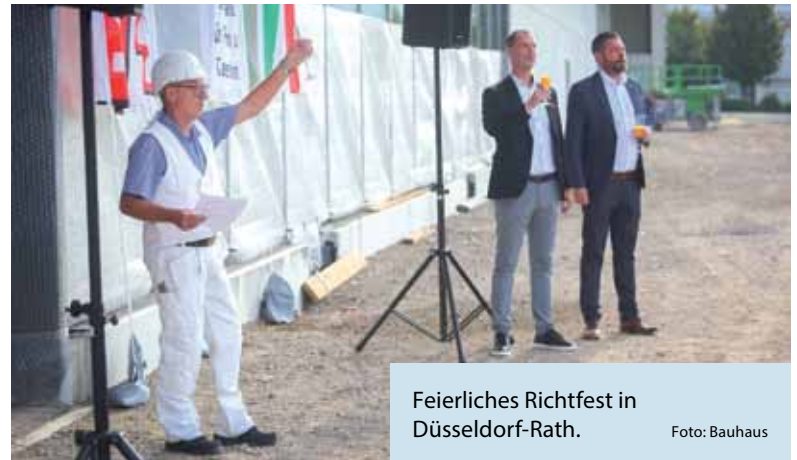
Feierliches Richtfest in Düsseldorf-Rath.