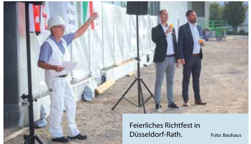
Feierliches Richtfest in Düsseldorf-Rath.