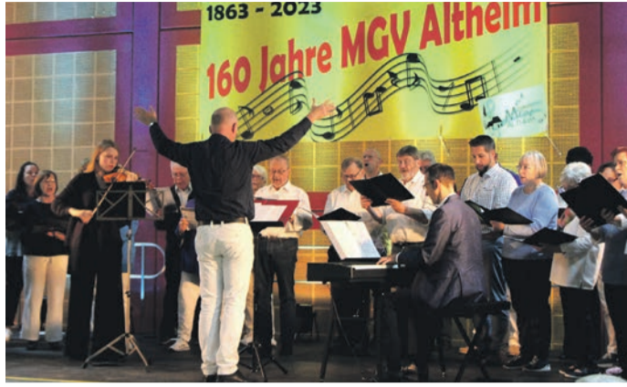
Der Projektchor des MGV Altheim wusste bei „Musikalischer Herbst“ zu überzeugen.