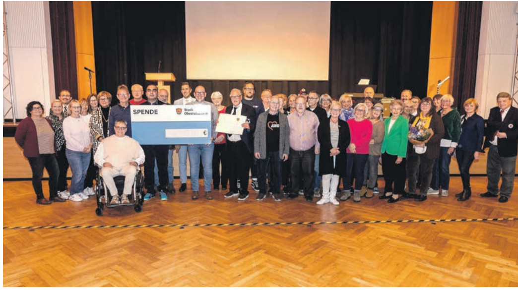
In nur elf Monaten hat „Das Lädchen“ eine erstaunliche Vielzahl von Aktivitäten etabliert. Nun gab es den Bürgerengagementspreis der Stadt Obertshausen.