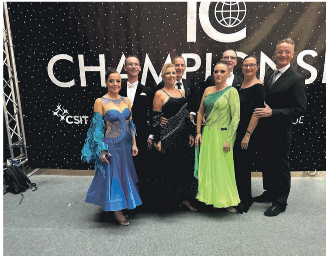
„Ein tolles Erlebnis in einem wunderbar festlich gestalteten Ambiente. Wir kommen nächstes Jahr wieder!“ so das übereinstimmende Fazit der Obertshausener Paare.