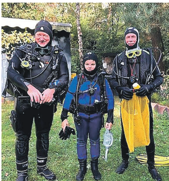
Der Wettergott meinte es gut mit den Tauchern.