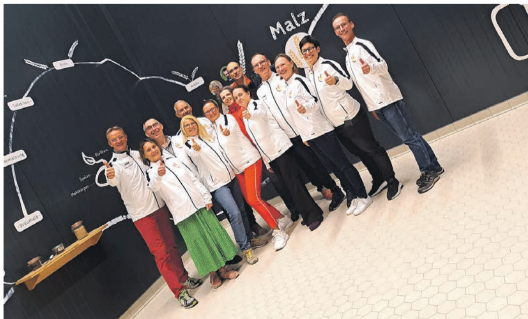
Bei Glaabsbräu in Seligenstadt stellten die Turnierpaare unerwartet viele Parallelen zu ihrer Art, Tanzsport zu treiben, fest.