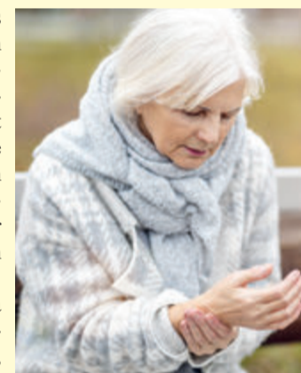
Rheuma macht sich vor allem, aber nicht nur bei Kälte und Nässe bemerkbar.

(akz-o) Was im Volksmund als Rheuma bezeichnet wird, ist ein Überbegriff für mehr als 400 verschiedene Erkrankungen des Bewegungsapparates, die nicht durch Verletzungen oder Tumore entstanden sind. Viele Menschen glauben, dass rheumatische Erkrankungen nur im höheren Alter auftreten, sie können aber in jedem Alter vorkommen. In Deutschland leiden zirka 140.000 Menschen an einer sogenannten Psoriasis-Arthritis, einer chronisch-entzündlichen, rheumatischen Erkrankung, die häufig, aber nicht zwingend, bei Menschen mit Psoriasis (Schuppenflechte) auftritt. Bei der Erkrankung, die bislang nicht heilbar ist, tritt Schuppenflechte (Psoriasis) in Kombination mit einer Entzündung der Gelenke (Arthritis) auf. In drei von vier Fällen erkrankt zuerst die Haut, durchschnittlich zehn Jahre später kommen Gelenkentzündungen hinzu. Die Psoriasis-Arthritis kann in vielen verschiedenen Ausprägungen auftreten. Häufige Symp-