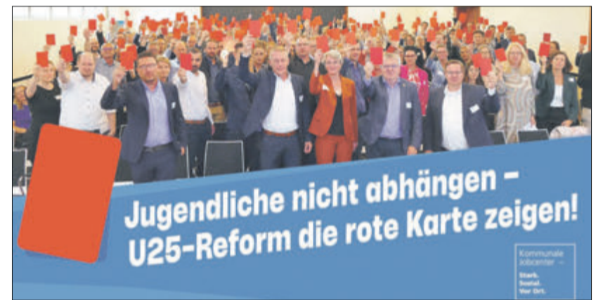
Bereits beim Tag der Kommunalen Jobcenter im September, bei dem auch Mitarbeitende des Kommunalen Job-Centers Odenwaldkreis anwesend waren, hatte man der geplanten U25-Reform die rote Karte gezeigt.

Erleichterung über Umdenken der Bundesregierung