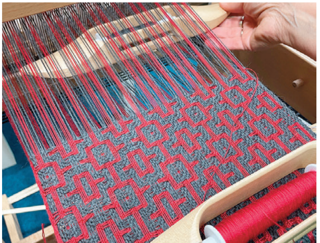
Selbstgewebtes vom Webstuhl ist nur eine der Sachen, die von den Kunsthandwerkern präsentiert werden.

Reichelsheim. Etwa 30 Aussteller werden am Sonntag, 12. November, in der Reichenberghalle, Konrad-Adenauer-Straße 1, ihre Produkte und Kunstwerke ausstellen. Zwischen 11 und 17 Uhr werden ausgefallene Mode und Schmuckstücke, Taschen, handgewebte Tücher, Schals und Decken, Wolle und Filz, Patchwork, Kalender, Fotokunst, Holzkunst, Malerei und Objektbilder, Keramik, Tonarbeiten und hausgemachte Leckereien zu sehen und zu kaufen sein. Organisiert wird der Markt von der Gemeinde Reichelsheim, den Anstoß zur Veranstaltung haben Hobby-Künstler und Kunsthandwerker gegeben. Der Eintritt ist frei. red