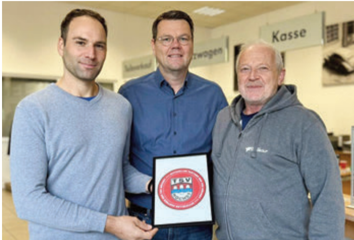
Eine Urkunde für anhaltendes Engagement im Sport.