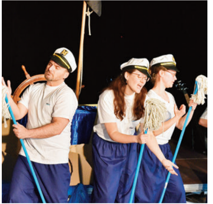
Auf großer Fahrt in der Karibik.

Reichelsheim. Das Ensemble des Novembertheaters führt am Samstag, 4. November, um 19.30 Uhr in der Reichenberghalle ihr neues Stück „Verfluchte Karibik“ auf. Thema ist Wasser in allen Formen, kombiniert mit Gedanken, Szenen und Träumen von Siegfried bis zur „Gersprenzfee“. Musikalisch wird Johann Sebastian Bach gespielt. Karten für die Aufführung gibt es bei der Herrnmühle und in der Parfümerie Rodenstein in Reichelsheim oder unter www.novembertheater.de . Kontakt: info@novembertheater.de . Infotelefon: 0170-9332363. red