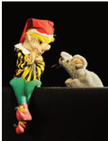
Kasperle und Maus.

Höchst. Das Kindertheater Papiermond führt am Sonntag, 29. Oktober, um 15.30 Uhr das Stück „Kasperle und das Zauberrätsel“ beim Treffpunkt Thierolf auf. Viele bekannte Figuren aus der Puppenkiste treten auf, um dem Zauberer Minimus aus einem Zauberspiegel herauszuhelfen. Ein Ticket kostet sieben Euro. Das Stück ist für Kinder ab drei Jahren geeignet und dauert etwa 40 Minuten. Alle Infos auf http://www.kindertheater-papiermond.de und unter 0172-9724456 sowie auf Facebook: http://www.facebook.com/papiermond . red