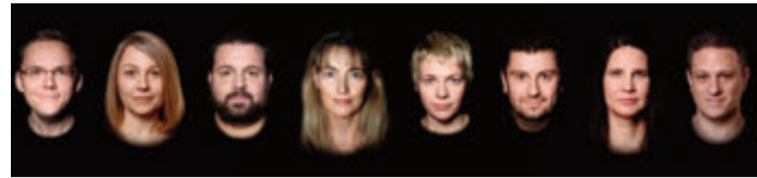
Die "Vielharmoniker" bieten ein breites Spektrum an Liedern.