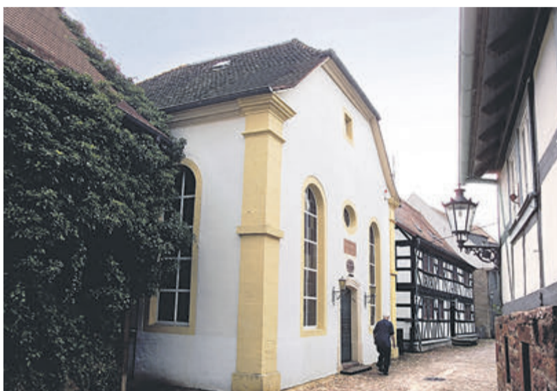
Die Synagoge in Michelstadt, in der auch das Dr.I.E.Lichtigfeld-Museum untergebracht ist.

2. Ist im Odenwaldkreis in der Vergangenheit Antisemitismus bemerkt worden? Garantiert. Mal als Friedhofsschändung,