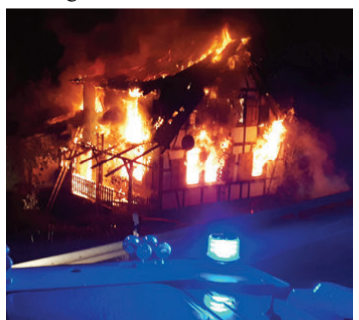
Das Haus brannte lichterloh.

„Es ist für uns selbstverständlich, nach dieser Katastrophe aktiv zu werden. Umso mehr, als dass Jari