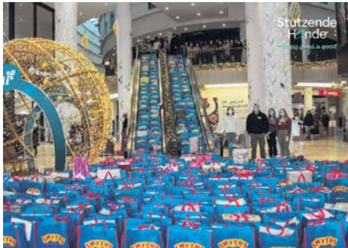
Die Weihnachtsaktion 2022.

CHARITY (PM) | Die Weihnachtszeit steht vor der Tür, und für die Stützenden Hände e.V. ist es eine Zeit mit besonderer Bedeutung. Zum siebten Mal in Folge sind wir bereit, die Herzen schwerkranker Kinder zu erwärmen und ihre Weihnachtszeit zu versüßen. In diesem Jahr wird unsere Weihnachtsaktion noch größer und bedeutungsvoller sein, da wir insgesamt sechs Krankenhäuser in verschiedenen Städten beliefern. Rund 2000 Geschenke werden an schwerkranke Kinder in den Krankenhäusern in Gießen, Mainz, Wiesbadener Hospiz, Darmstadt, Offenbach