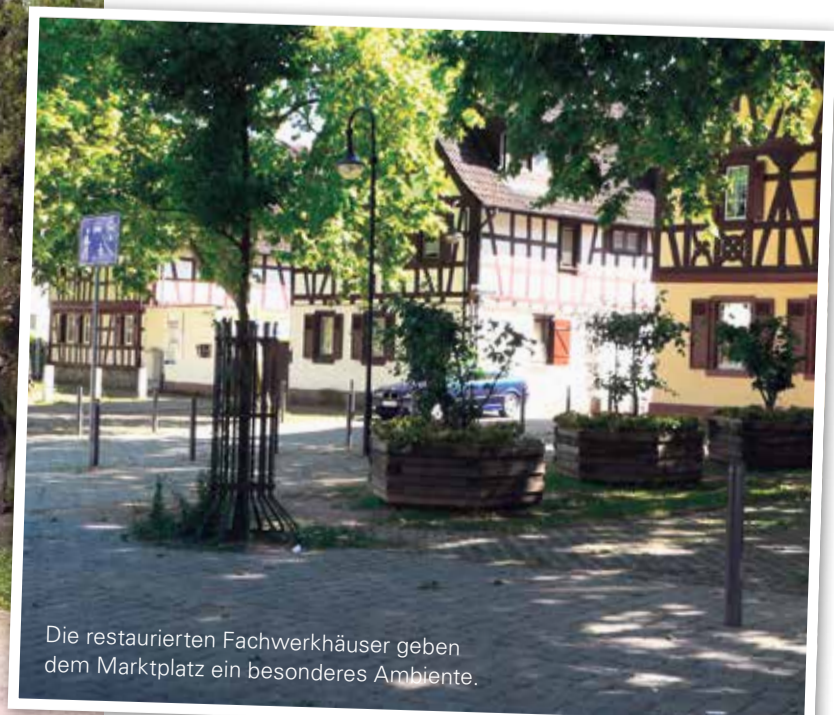
Die restaurierten Fachwerkhäuser geben dem Marktplatz ein besonderes Ambiente.