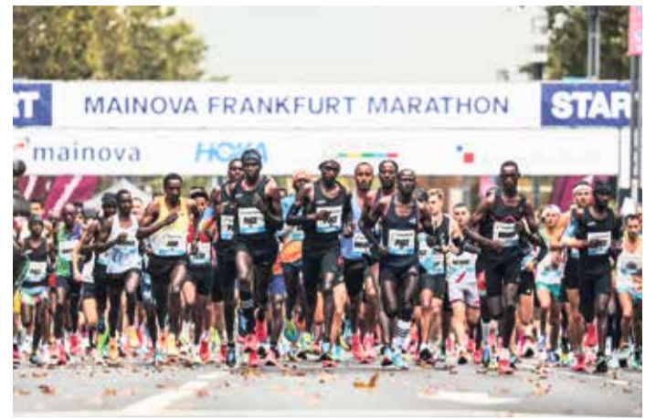
Start des Mainova Frankfurt Marthon 2023.