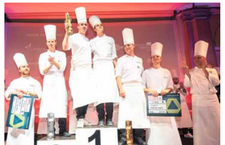
Die Gewinner des Bocuse d'Or.

Das Deutschlandfinale wurde in diesem Jahr erstmalig im wunderschönen Ambiente des Gesellschaftshauses Palmengarten ausgetragen. Über 500 Zuschauer zog es in dieser Woche zum Deutschlandfinale im Palmengarten. Sie bekamen die Gelegenheit den Profiköchen über die Schulter zu schauen und sich in Masterclasses über Wein, Champagner und Social-Media-Aktivitäten in der Gastronomie informieren. „Die Leistungen, die wir hier