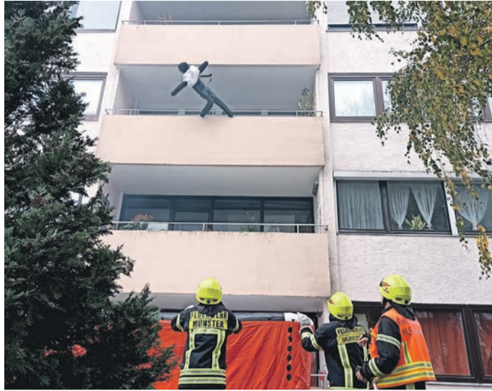
Ein Sprungretter beziehungsweise Sprungpolster wurde ebenfalls aufgebaut.

ders guter Blick ohne im Weg zu stehen. Obwohl es nur eine Übung war, erlebten die Zuschauer dramatische Szenen: Von den Fenstern und Balkonen drang mächtig Rauch, Menschen riefen panisch um Hilfe. „Wir sind gleich da. Bleiben Sie dort! Bleiben Sie ruhig! Es wird alles gut!“, versuchten die Retter zu beruhigen und bauten umgehend ein Sprungpolster auf, was die moderne Version des Sprungtuchs verkörpert. Auf dem landete dann ein Dummy. Angelika Donezkow (24) und Heinrich Haase (25) wohnen seit drei Jahren im dritten Stock des Hochhauses und verfolgten aufmerksam das Szenario, bei dem sowohl ein Teleskopmast und eine Drehleiter zum Einsatz kamen. „Die Hausverwaltung hat uns über die Übung unterrichtet“, berichtet das Paar. Die Frage, ob bei diesem Anblick nicht ein mulmiges Gefühl entsteht, im Notfall vielleicht im Hochhaus gefangen zu sein, wird verneint. „Die Technik der Feuerwehr und der Brandschutz sind heutzutage weit fortgeschritten“, antwortet Haase. Auch kürzlich, als eine Stichflamme im Gebäude die Feuermelder auslöste und einige Bewohner nach draußen gingen, habe alles ganz gut geklappt. „Zudem verfügen wir noch über junge