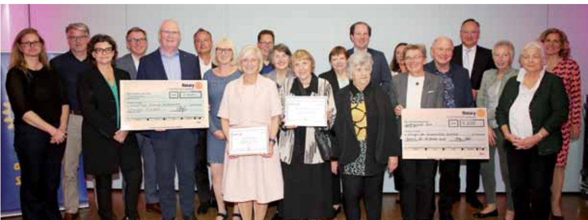
Die Verleihung des Rotary-Preises für soziales Engagement. Mehr dazu lesen Sie auf Seite 2.