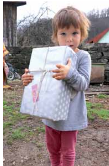
Ein Mädchen in Rumänien mit ihrem Weihnachtspäckchen.

Wer Interesse hat mitzuhelfen, kann mit der Stiftung Kontakt per E-Mail Ehrenamt.Weihnachten@Kinderzukunft.de oder Telefon