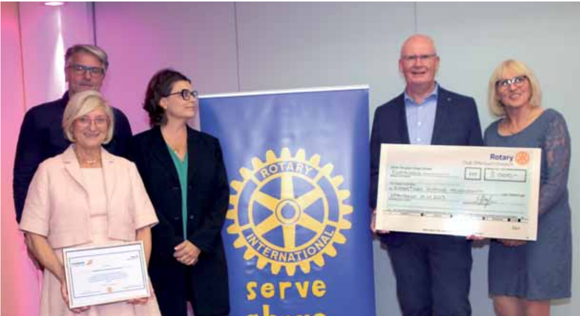
Einen Scheck über 5.000 Euro erhielt die Bürger*innen Stiftung Heusenstamm.

2 x 5.000 Euro gingen als Preisgelder für soziales Engagement in die Region