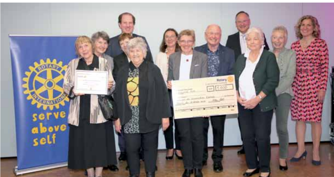
Der Seniorenclub Dreieich freute sich sehr über die Ehrung und den Betrag von 5.000 Euro.

Beide Preisträger bedankten sich sehr für die Förderung und die Auszeichnung durch den Sozialpreis. Damit konnte von den Rotary Clubs durch die Auswahl der Preisträger wieder vorbildliches Handeln geehrt und unterstützt werden.