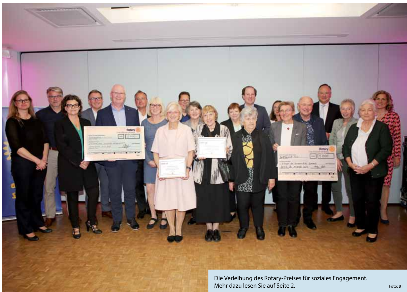
Die Verleihung des Rotary-Preises für soziales Engagement. Mehr dazu lesen Sie auf Seite 2.