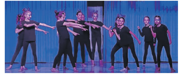
Auftritt der Tanzformation „Enerisma“

Münster (MA) Eingestimmt wurde die Vereinsfamilie auf die eigentliche Party mit Auftritten aus den eigenen Reihen. So konnten die „Jubiläumskids“ ihr Publikum mit einem Tanz zu dem Titel „Breathe Eayse“ von „Blue“ erfreuen. Darüber hinaus zeigte die Gruppe „Energy“ ihr Können auf der Bühne zu dem Lied „Girls“ von Markus und Martinus. Den schwungvollen Schlussspunkt des ersten Teils der Veranstaltung setzte die Formation „Enerisma“ die ihr Publikum mit Choreografien zu „Everybody“ von den Backstreet Boys und „Thriller“ von Michael Jackson zu begeistern wussten. Zum gemeinsamen flashmob trafen sich dann Jung und Alt auf der Bühne und auf der Tanzfläche. Für die Kinder war eigens ein Sportgeräteparkour aufgebaut, an dem