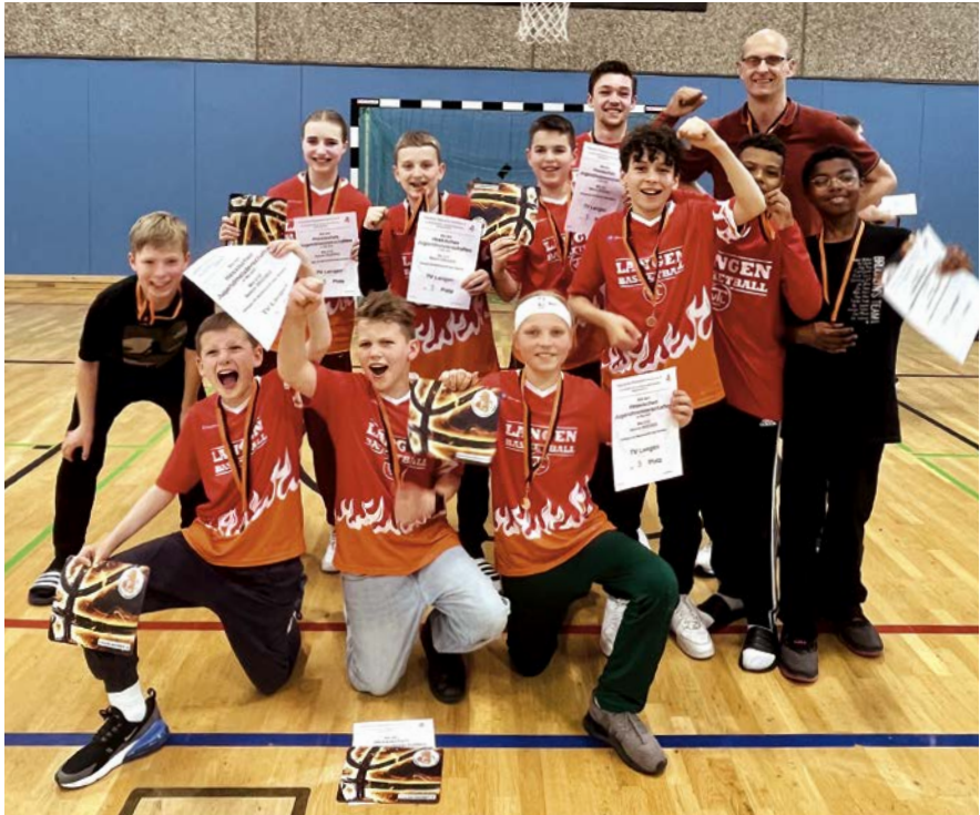
Die U12-Mix jubeln nach erfolgreicher Saison

beendeten sie mit dem 4. Platz. Auch in der kommenden Saison wird das Trainer-Team Graichen/Mundt die ehrgeizigen U12-Jungen 1 betreuen. Die U12-Jungen 2 starten mit den Trainern Evgeniy Markov, Leander Schumacher und Yannick Fischer in die Bezirksliga.