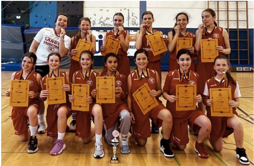
Große Freude der U12-Mädchen mit den Sieger-Urkunden des HBV