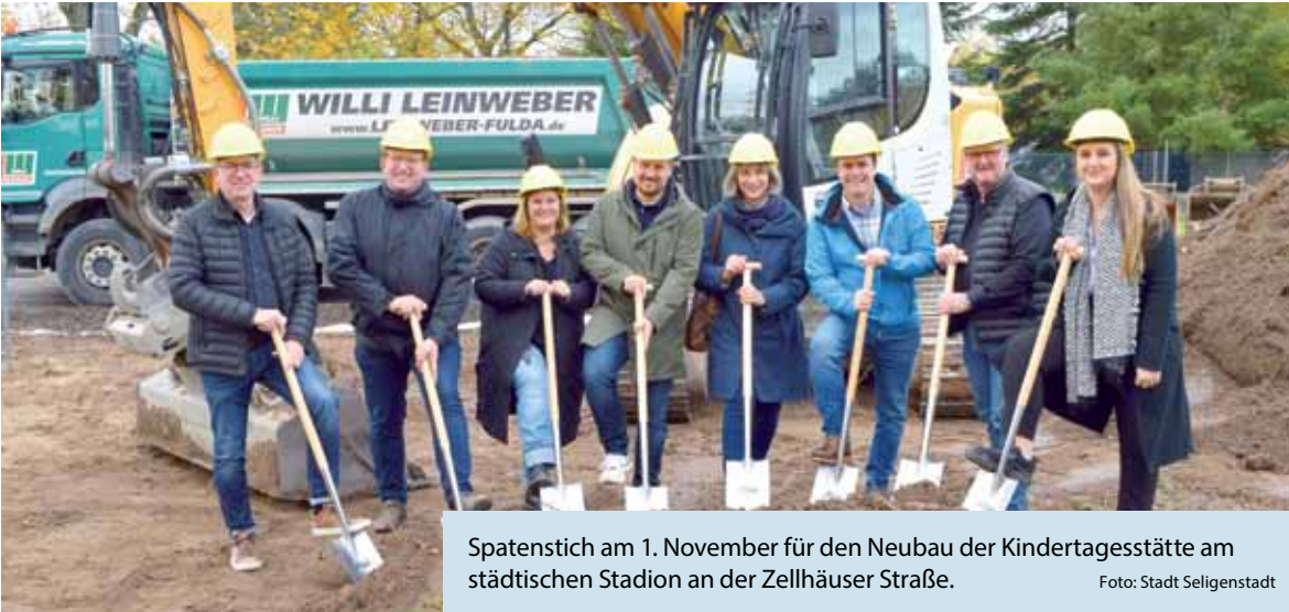
Spatenstich am 1. November für den Neubau der Kindertagesstätte am städtischen Stadion an der Zellhäuser Straße.