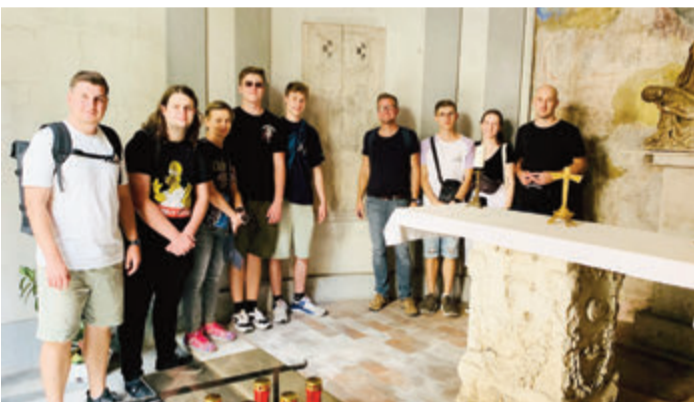
Delegation der Reichelsheimer GAZ-Schüler mit ihren Lehrkräften vor der Grabplatte von Junker Hans III. zu Rodenstein auf dem deutschen Friedhof im Vatikan.

Reichelsheim/Rom. Eine besondere Studienfahrt unternahm die dreizehnten Klassen der Georg-August-Zinn-Schule Reichelsheim (GAZ) rund ein halbes Jahr vor den anstehenden Abiturprüfungen.