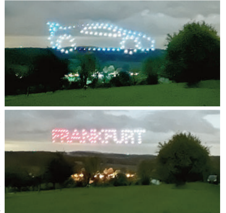
Die Lichterdrohenschau am vergangenen Samstag erstrahlte über Lützelbach und begeisterte die Zuschauer.

Höchst. Wegen der Änderung des Passgesetzes zum 1. Januar 2024 dürfen Kinderreisepässe nach dem 31. Dezember nicht mehr ausgestellt, verlängert oder aktualisiert werden. Bereits ausgestellte Kinderreisepässe sind bis zum aufgedruckten Ablaufdatum gültig. Wie aus einer Pressemeldung der Gemeinde Höchst hervorgeht, werden künftig auch für Kinder je nach Reiseziel ein Personalausweis oder ein biometrischer Reisepass ausgestellt. Eine Ausweispflicht besteht weiterhin erst ab einem Alter von 16 Jahren, soweit kein Dokument für eine Auslandsreise benötigt wird. Um Ausweisdokumente für Minderjährige zu beantragen, be-