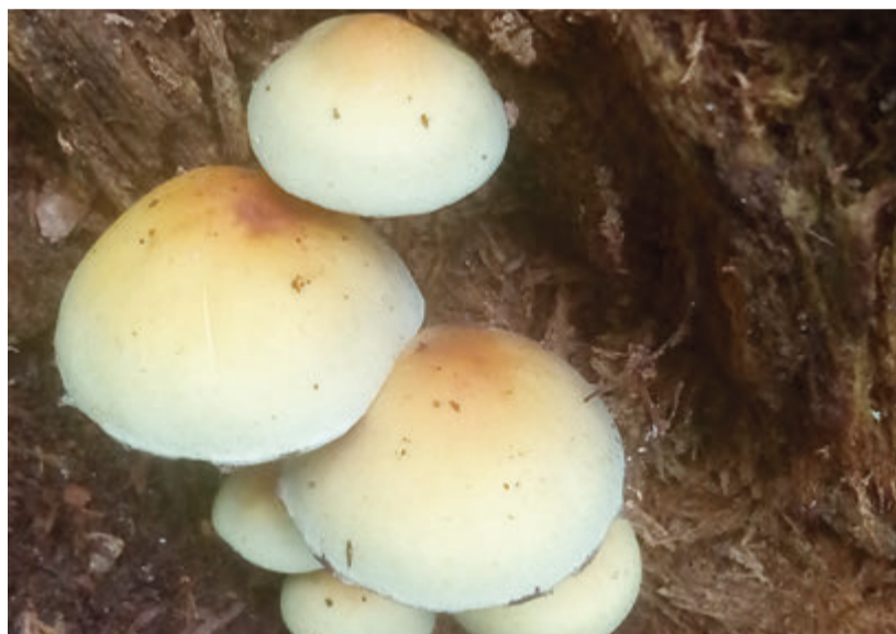
Essbar oder nicht? Im Zweifelsfall sollte man den Pilz lieber stehenlassen oder einen Experten fragen.

Speisepilze enthalten viele Mineralstoffe, Spurenelemente und Vitamine wie Kalzium, Magnesium, Zink, Selen oder Vitamin D. Damit sind sie wie andere frische Früchte gesund. Aber auch