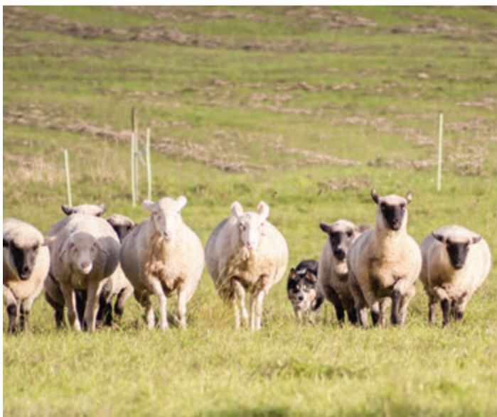
Eine Herde will auch gehütet sein - etwa durch einen Hütehund.

Es handelt sich um eine theoretische Ausbildung, die die einzelnen Ausbildungsschritte bis zu einem ausgebildeten Hund zeigt. Mitgebrachte Hunde können an diesem Tag nicht trainiert werden. red