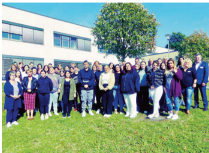
Die Auszubildenden der Pflegeschulen.

Erbach. Zwei neue Kurse mit knapp 50 Auszubildenden starteten am 1. Oktober ins neue Ausbildungsjahr an den Pflegeschulen des Odenwaldkreises der Gesund-