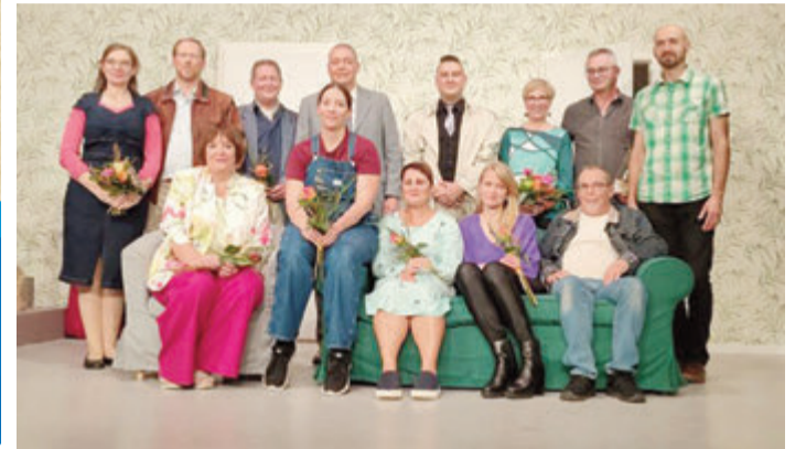
Das Ensemble der Bannoser.