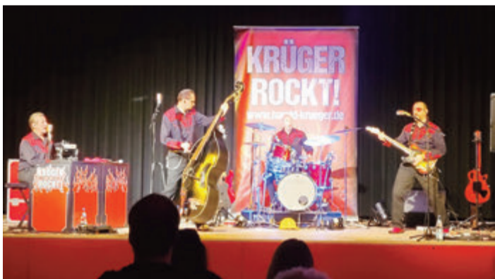
Mit Kontrabass und E-Gitarre - Krüger Rockt! in der Alten Turnhalle.

Oberzent. Der Verein „Generation Oberzent e.V.“ hat am Samstag, 28. Oktober, die Band „Krüger Rockt“ nach Beerfelden geholt.