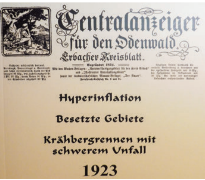
Nachrichten aus dem Odenwald von vor hundert Jahren.