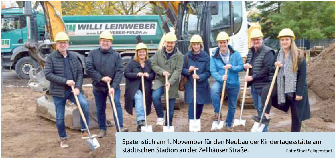
Spatenstich am 1. November für den Neubau der Kindertagesstätte am städtischen Stadion an der Zellhäuser Straße.