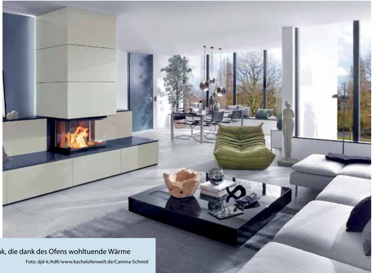
Zukunftssichere Geldanlage: Eine Bank, die dank des Ofens wohltuende Wärme ausstrahlt.

Über Kachelöfen, Heizkamine und Kaminöfen zur Aufwertung einer Immobilie kann man sich umfassend bei einem Ofenbauer informieren. Adressen in der Nähe gibt es auf www.kachelofenwelt.de .