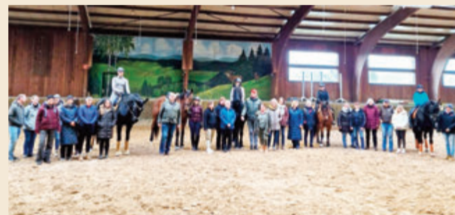
Die Teilnehmer der Trainerfortbildung des Kreisreiterbundes Odenwald in der Halle des gastgebenden RFVO in Beerfelden.

Oberzent. Am Samstag, 4. November, fand die vom Kreisreiterbund Odenwald vermittelte Trainerfortbildung mit Referenten des Pferdesportverbands Hessen auf der Anlage des Reit- und Fahrvereins Oberzent (RFVO) in Beerfelden statt. Als Unterrichtsleiter konnten Jürgen Weber und Erik Schlaudraff vom PSV Hessen gewonnen werden. Als Themen standen Balance, Losgelassenheit sowie Motivation von Reiter