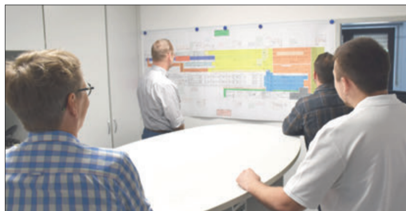
Mitarbeiter des Kommunalen Job-Centers informieren sich über die Arbeit der Lohwasser Elektrotechnik GmbH in Lützelbach.

Lützelbach. Beim jüngsten Unternehmensbesuch erhielten Kommunales Job-Center (KJC) und InA gGmbH Einblicke in Aufgabengebiete, Arbeitsabläufe und Mitarbeiterstrukturen der Lohwasser Elektrotechnik GmbH aus Lützelbach. Das Unternehmen, stattet namhafte Unternehmen vor allem aus der Automobilbranche, mit individuell gefertigten Schaltschranken und der dazugehörigen Software aus.