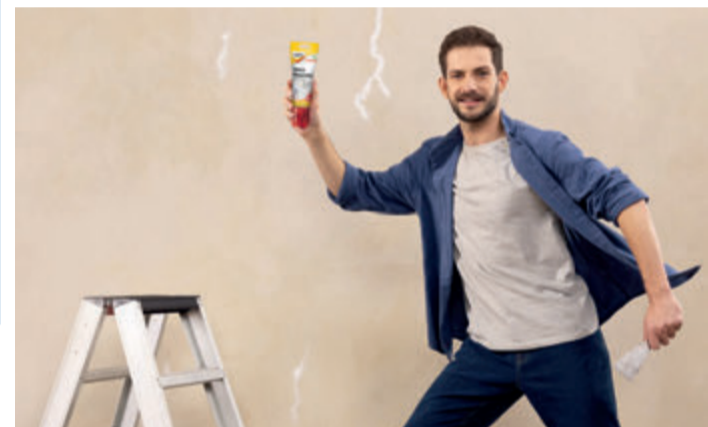
Gebrauchsfertige Spachtelmassen in der Tube sind die clevere Lösung für unterschiedliche Heimwerkerprojekte.