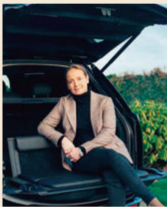
Isabell Werth

Kronberg. Vorbild, Vorzeigethletin und Vorreiterin - Isabell Werth hat mit ihrer beispiellosen Karriere Sportgeschichte geschrieben. Gleich sieben Olympiasiege, neun WM-Titel und unzählige nationale wie internationale Triumphe machen sie zur erfolgreichsten Dressurreiterin der Welt. Nun schlägt die gebürtige Rheinländerin ein neues Kapitel in ihrer ruhm- wie abwechslungsreichen Karriere auf: Isabell Werth wird Markenbotschafterin für Land Rover – eine exklusive Verbindung mit gemeinsamen Werten. Isabell Werth blickt auf eine weltweit einzigartige Karriere zurück. Vor über 35 Jahren ihre Passion zum Beruf gemacht, ist sie die bis heute erfolgreichste Reiterin in der Geschichte. „Ich beschäftige mich 24 Stunden am Tag mit Pferden, sie sind meine große Leidenschaft“, erklärt Isabell Werth. Um in Wettkämpfen erfolgreich zu sein, ist für sie