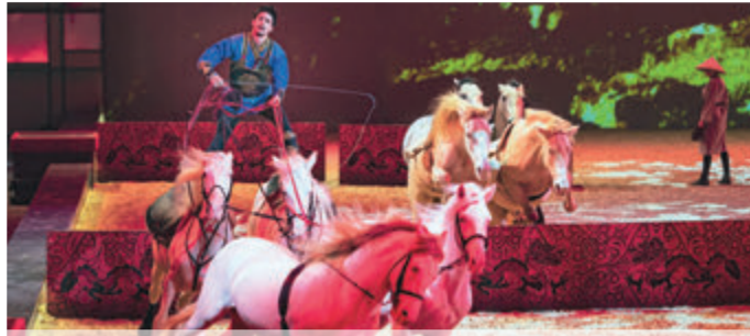
Pferdereion Odenwald im Fokus Seiten 10-11