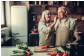
Vitamine sind wichtig – auch im Alter.

Das eine abwechslungsreiche, ausgewogene Ernährung wichtig für die Gesundheit ist, weiß im Grunde jeder. Und doch ist laut einer repräsentativen Studie jeder Vierte über 65 Jahren nicht ausreichend mit Vitamin B12 versorgt. 1 Die Gründe dafür sind vielfältig: Da sich der Geschmacks- und Geruchssinn im Laufe des Lebens verändern, haben viele Menschen mit den Jahren weniger Appetit oder werden schneller satt. Dazu kommt, dass auch bestimmte Erkrankungen und Medikamente die Aufnahme von Vitaminen in den Körper beeinträchtigen können. So verbreitet er jedoch auch ist: Oft fällt ein Mehrbedarf an B-Vitaminen gar nicht auf – und das kann sich auf Dauer z. B. auf die geistige Leistung 2 auswirken oder sich in Form von Müdigkeit und Antriebslosigkeit bemerkbar machen. Die 8 B-Vitamine sorgen im Körper für Energie 3 und Konzentration 2 . Dabei er-