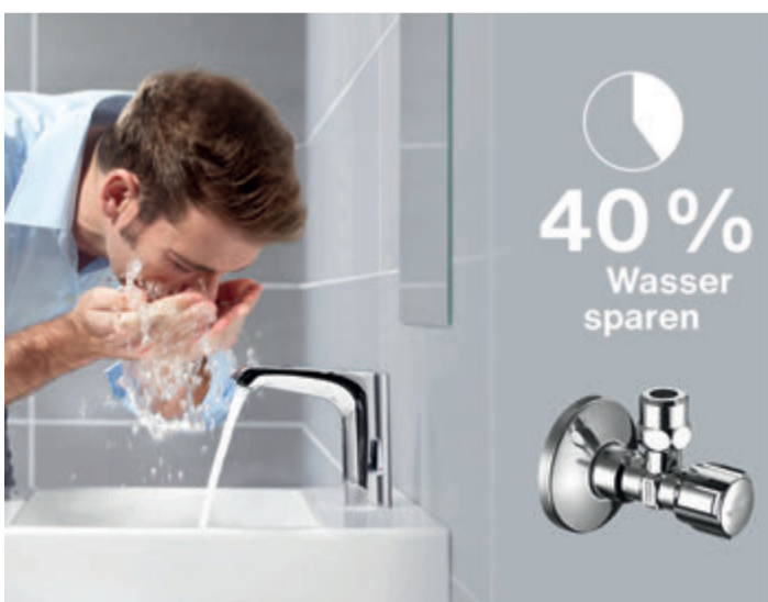
Spartipp unter dem Waschtisch: Eckventile mit Regulierfunktion lassen sich mit wenigen Handgriffen so einstellen, dass Wasser- und Energieverbrauch reduziert werden.