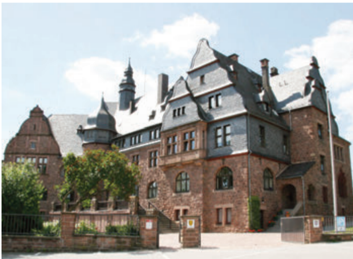
Im Landratsamt gibt es bald eine Ausstellung.

Sowohl in der Öffentlichkeit stehende, aber auch eher unbekannt Odenwälder werden auf Fotos oder gemalten Bildern in unterschiedlichen Materialien präsentiert.