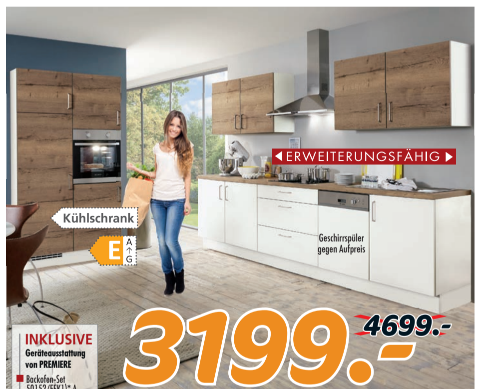
TESSI 30 Top-Moderne Anbauküche. Fronten in Kst. Magnolia und Eiche Havanna Nachbildung, ca. 120 / 310 cm, inkl. einer hochwertigen Geräteausstattung und Einbauspüle. Ohne Beleuchtung.

bis zu 50% JETZT AUF FREI GEPLANTE KÜCHEN