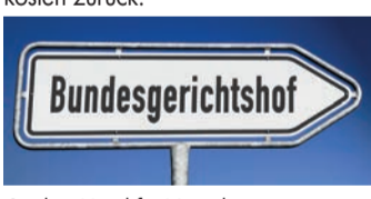
Starkes Urteil für Versicherte.

Ob Ihr Vertrag betroffen ist, prüft zum Beispiel das Düsseldorfer Verbraucherportal helpcheck.de gratis und unverbindlich für Sie. Die Prüfung erfolgt auf Basis Hundertur Urteile datenbankgestützt und individuell durch spezialisierte Anwälte. Sie werden nach der Vertragsprüfung beraten und können das Unternehmen, sofern Sie wünschen, rein auf Erfolgsbasis mit der Durchsetzung Ihres Anspruchs beauftragen. Das bedeutet für Sie: Sie können nur gewinnen, da Sie nur einen Anteil des für Sie bei Ihrer Versicherung erzielten finanziellen Mehrwertes an das Verbraucherportal bezahlen. Ein fairer Deal, denn das Geld, das Sie ohnehin von der Versicherung erhalten hätten, bleibt komplett unangetastet. Das Unternehmen hat bereits über 50 Millionen Euro an seine Kunden ausbezahlt. Die gratis Vertragsprüfung finden Sie hier: www.helpcheck.de/auszahlung