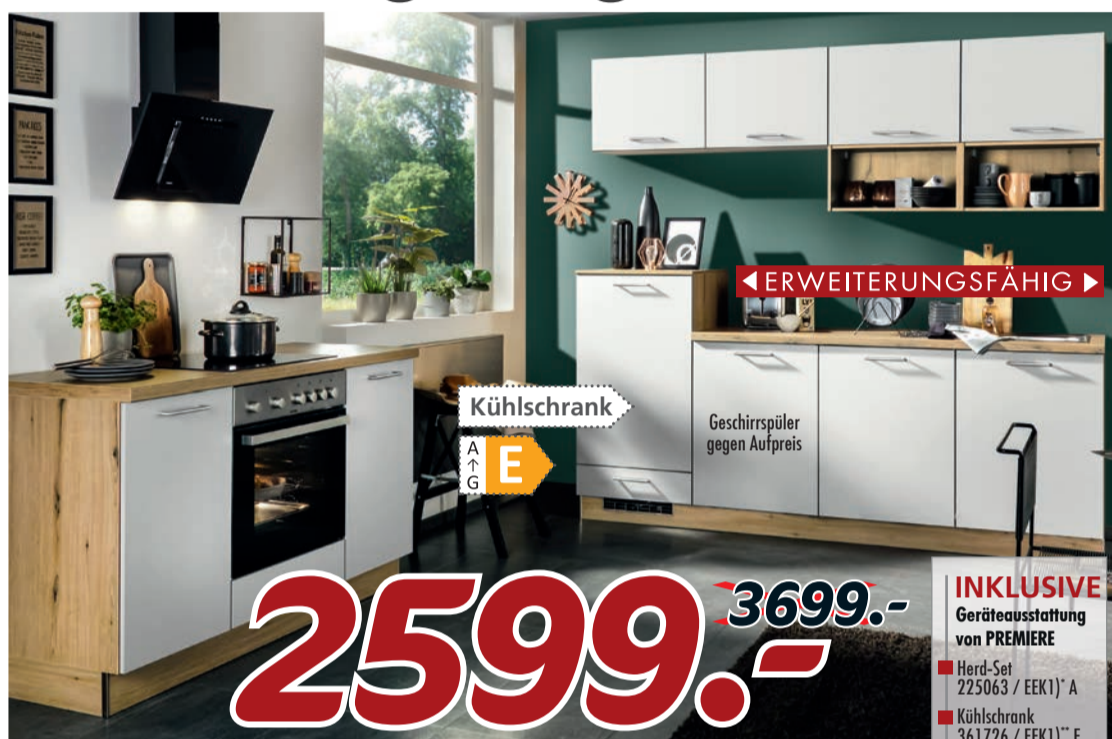
MOONA 1 Top-Moderne Anbauküche. Fronten in weiß und Eiche astig Nachbildung, ca. 150 / 240 cm. Super ausgestattet mit Elektrogeräten und Einbauspüle. Ohne Beleuchtung.