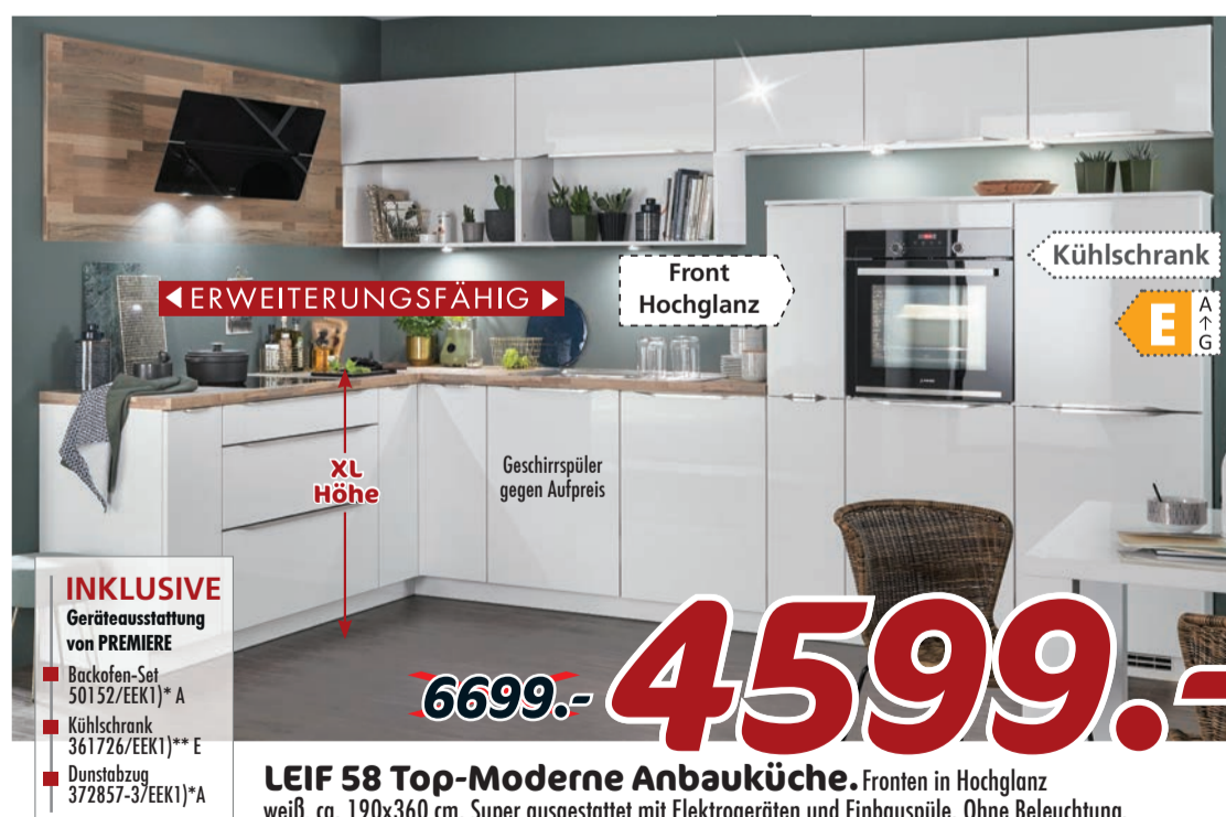
LEIF 58 Top-Moderne Anbauküche. Fronten in Hochglanz weiß, ca. 190x360 cm. Super ausgestattet mit Elektrogeräten und Einbauspüle. Ohne Beleuchtung.