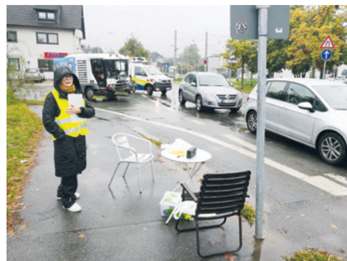
Kartierung der Schrankenschließzeiten am Bahnübergang Jägertorstraße, 24. Oktober 2023, unter widrigen Wetterbedingungen.

Unterführung am Bahnübergang Jägertorstraße und Sofortmaßnahmen gegen überlange Schrankenschließzeiten