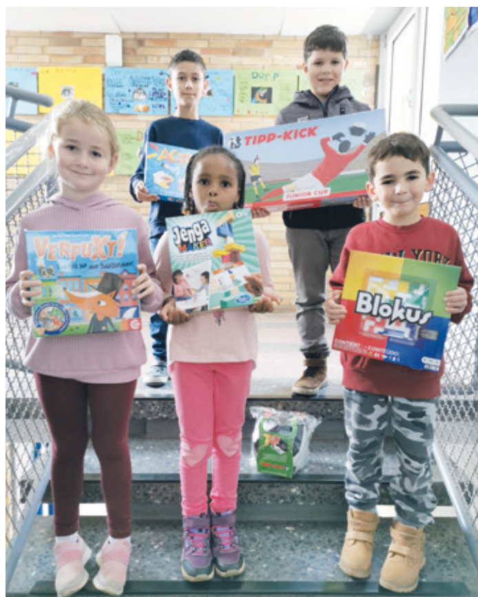
Schülerinnen und Schüler der Lessingschule mit einer Auswahl der gewonnenen Spiele.

Die Initiative „Spielen macht Schule“ wurde vom Verein Mehr Zeit für Kinder und dem ZNL Transferzentrum für Neurowissenschaften und Lernen ins Leben gerufen. Unterstützt wird die Initiative, die in diesem Jahr zum 17. Mal ausgeschrieben wurde, von den 16 Kultusministerien. Um ein Spielzimmer