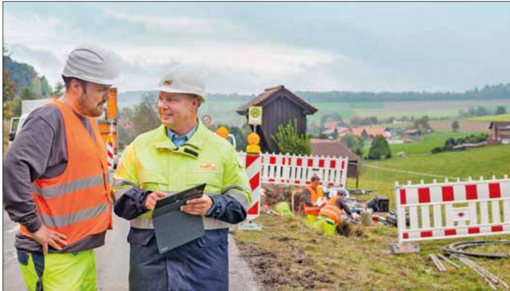
Qualitätssicherungsbeauftragter der e-netz Süd Hessen bei der Kontrolle der Sicherheitsbestimmungen.

Für den Bereitschaftsdienst stehen 180 Arbeitskräfte zur Verfügung, davon sind 27 immer zeitgleich im Einsatz. Bei Störungen außerhalb der regulären Arbeitszeit werden Mitarbeiter*innen mit der kürzesten Anfahrtszeit alarmiert. Zudem gibt es Bereitschaftsdienste, die für das gesamte Netzgebiet zuständig sind. Die Querverbundleitstelle (QVL) am Dornheimer Weg in Darmstadt ist