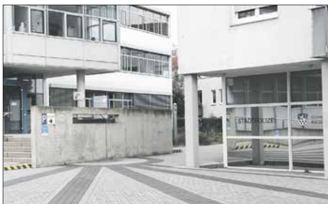
Die Stadtpolizei Riedstadt ist in ein Nebengebäude des Rathauses gezogen.

Die Eröffnung der neuen Räumlichkeiten wird am Donnerstag, 23. November ab 14 Uhr auf dem Rathausplatz begangen. Es wird Gelegenheit geben, die neuen Räumlichkeiten zu besichtigen, zudem werden das Fahrzeug der Stadtpolizei sowie das mobile und das semistationäre Messgerät zur Geschwindigkeitsmessung, der sogenannte „Blitzanhänger“, ausgestellt. Im Rahmen der Eröffnung wird es bereits von 12 bis 16 Uhr auf dem Rathausplatz einen Polizeiinformationstag geben. In einem Infomobil der Polizei wird umfassend