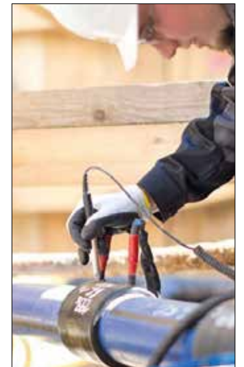
Rohrsystemtechniker der ENTEGA bei der Erstellung einer Rohrverbindungs-muffe auf einer PE-Leitung

E-NETZ SÜDHESSEN AG Dornheimer Weg 24 64293 Darmstadt T. 06151 701-5050 www.e-netz-suedhessen.de