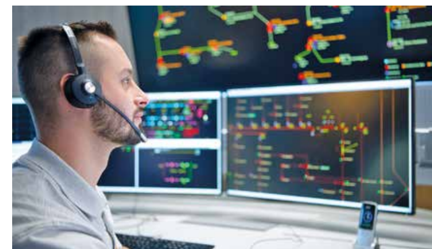
Schaltmeister in der Querverbundleitstelle der e-netz Südhesen bei der Kontrolle und Überwachung des Versorgungsnetzes

E-NETZ SÜDHESEN AG Dornheimer Weg 24 64293 Darmstadt T. 06151 701-5050 www.e-netz-suedhesen.de