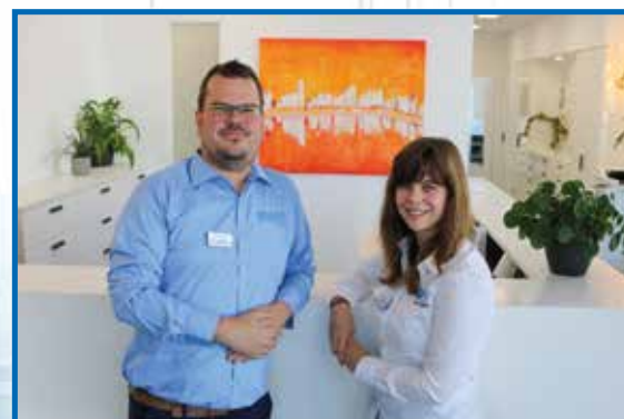
Unser Team in Reinheim freut sich auf Ihren Besuch!