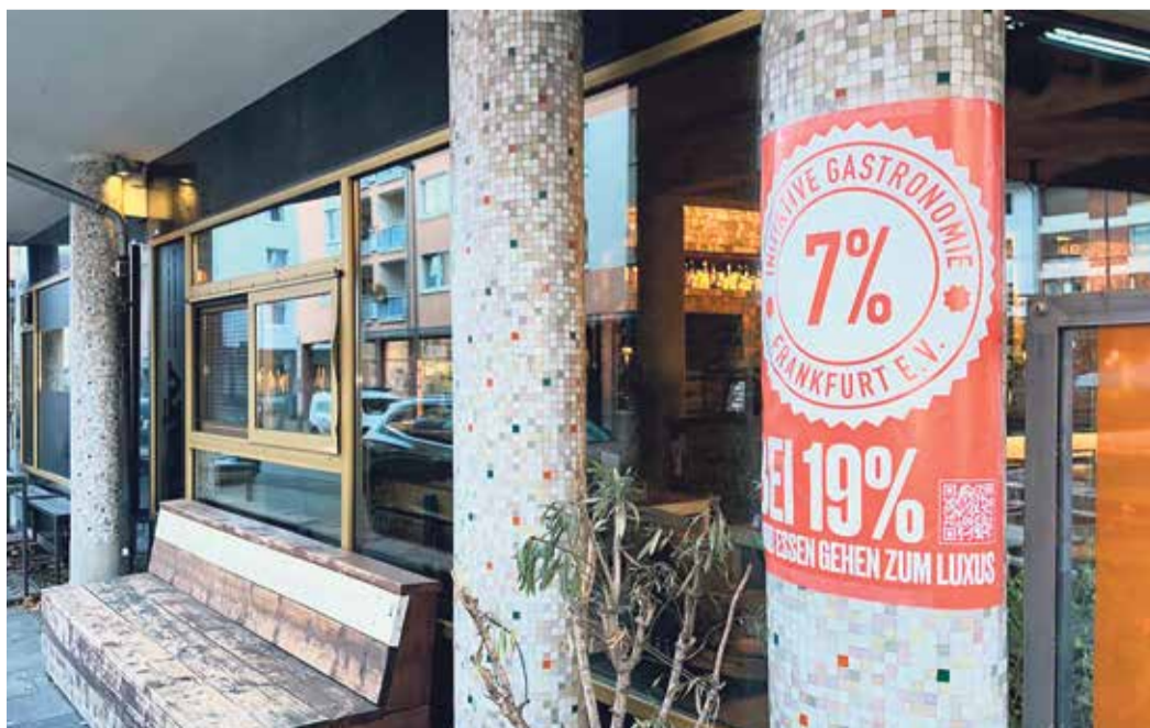
Nicht nur online sagt die IGF „Nein“ zur geplanten Mehrwertsteuererhöhung von 7 auf 19 Prozent. Auch in den Mitgliederbetrieben – wie im Restaurant naiv in der Frankfurter Innenstadt – macht der Verein auf die Plakat-Aktion aufmerksam.

Initiative zu einer verbesserten und positiven öffentlichen Wahrnehmung der Gastronomieszene beitragen und in diesem Sinne das Gewerbe attraktiver, gerechter und sicherer für nationale und internationale Gäste sowie Arbeitgeber und Arbeitnehmer machen. Unterstützt wird der Vorstand von einem derzeit vierköpfigen Beirat. Aktuell gehören der IGF rund 100 inhabergeführte Betriebe aus Frankfurt und Offenbach an.