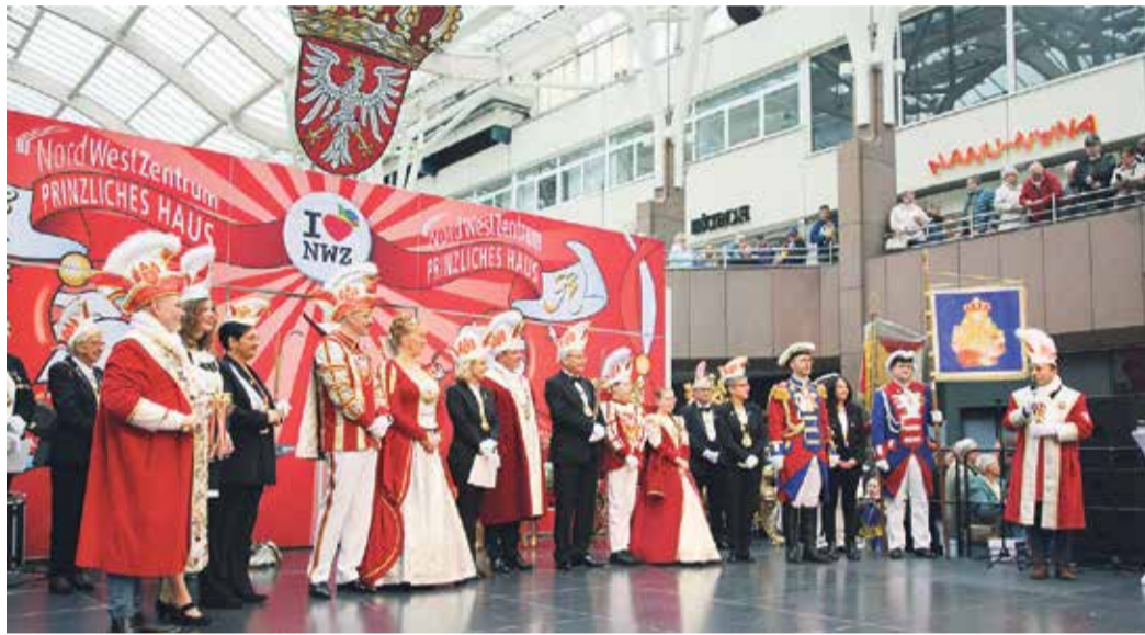
Und los geht es. Voller Vorfreude wurden die Prinzenpaare der Saison 2023/2024 vorgestellt.