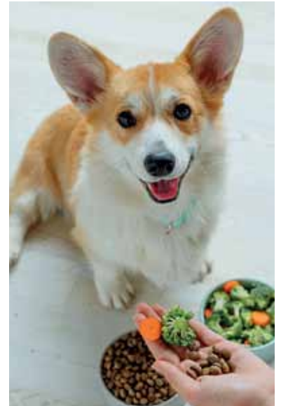
Weniger Fleisch zu füttern ist nicht schwer: Hundefutter sowie Snacks und Belohnungen für zwischendurch gibt es mittlerweile in vegetarischen Varianten.

Neben der „Hauptmahlzeit“ lässt sich insbesondere bei Snacks und Dental Sticks der Fleischanteil reduzieren, die die neue Linie ebenfalls umfasst. Denn sowohl die Belohnung im Training oder beim Gassi gehen als auch der Knabberspaß für saubere Zähne müssen nicht immer tierischen Ursprungs sein. Hauptsache, es schmeckt dem Vierbeiner. Und das scheint kein Problem zu sein, denn in Futtertests haben sich die vegetarischen Varianten bewährt und stehen fleischhaltigen nicht nach. Damit sich die Verdauung wie bei jedem anderen Futterwechsel auch an das neue Futter gewöhnen kann, wird empfohlen, das gewohnte Futter in Teilen durch kleinere Mengen des neuen Futters zu ersetzen und den Anteil dann langsam zu steigern. So steht einem regelmäßigen Veggie-Tag für Zwei- und Vierbeiner nichts mehr entgegen.