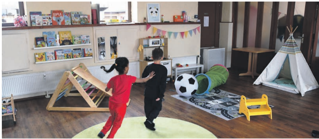
Ein Foto aus der Zeit, als im Haus Valentin noch Leben herrschte. Seit Oktober steht das von der Gemeinde Eppertshausen für die Kindertagespflege angemietete Objekt im Müllersgrund leer.

In Eppertshausen haben nach und nach alle Kindertagespflege-Personen aufgehört / Gemeinde sucht nach neuen