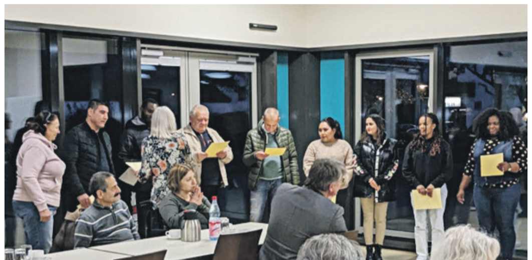
Die Teilnehmer*innen des samstägliches Deuschtreffs erhielten für das regelmäßige Deutschlernen eine Auszeichnung.

Eppertshausen (EA) Am letzten Freitagnachmittag hatte der Ehrenamtskreis Eppertshausen sowohl die alteingesessenen als auch die neu zugezogen Bürger*innen in den kleinen Saal der Bürgerhalle eingeladen. Die zahlreichen Besucher*innen genossen bei Kaffee und Kuchen einige schöne Stunden.