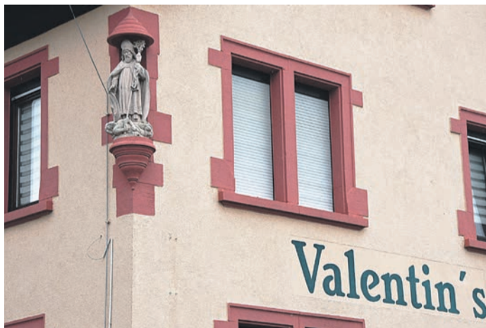
Seit Oktober steht das von der Gemeinde Eppertshausen für die Kindertagespflege angemietete Haus Valentin im Müllersgrund leer.