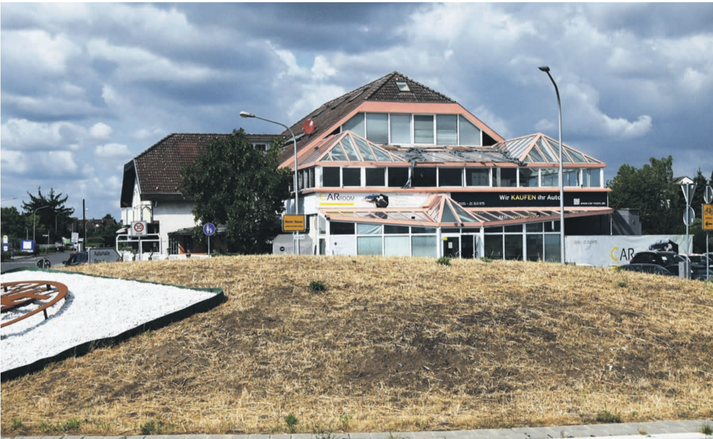
Ein Bild aus diesem Sommer: Der Kreisel an der Feuerwehr respektive der ehemaligen Diskothek Tropical (hinten) gibt ein tristes Bild ab. 2024 soll er mit für die Feuerwehr charakteristischen Symbole „Löschen, Retten, Bergen, Schützen“ neu gestaltet werden.

Gemeindevertretung: Investor will in der Darmstädter Straße bauen / Feuerwehr-Kreisel soll 2024 neu gestaltet werden / Haushalt wird erst im Dezember eingebracht