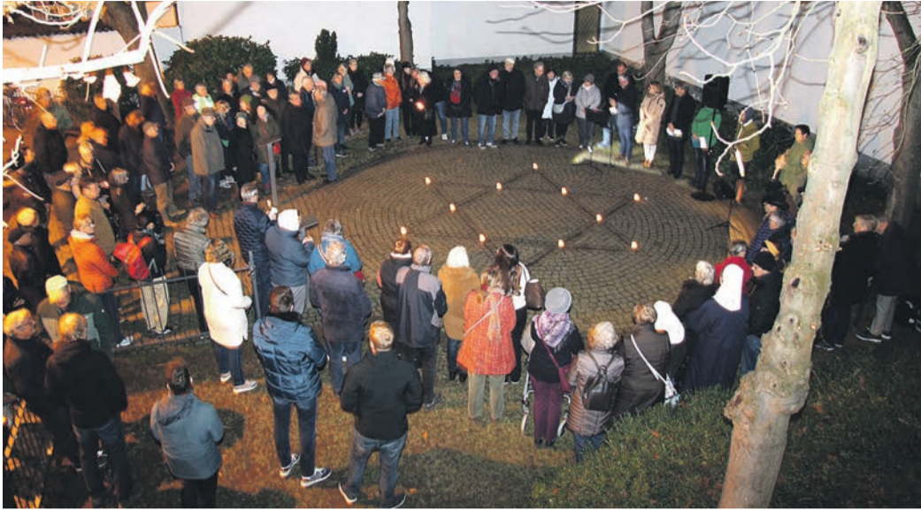
Rund 150 Menschen, fast dreimal so viele wie durchschnittlich in den vergangenen Jahren, versammelten sich zum Gedenken.