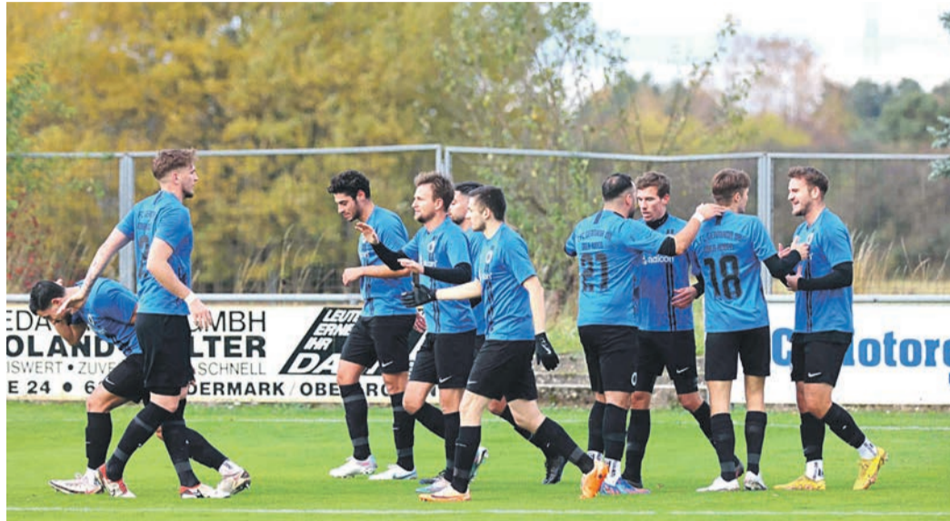
Die Spieler von Germania Ober-Roden bejubeln in dieser Szene den Treffer zum 1:0 gegen Dortelweil. Am Ende setzte sich die Germania mit 2:1 durch und belegt in der Verbandsliga Süd nach der Hinrunde den vierten Platz.

Germania Ober-Roden beendete in der Verbandsliga Süd die Hinrunde auf dem vierten Platz. Gegen den SC Dortelweil gab einen 2:1 (1:0)-Sieg. „Das war wie erwartet ein hartes Stück Arbeit. Aber insgesamt hatten wir die gefährlicheren Szenen“, sagte Germania-Trainer Fabian Bäcker. Marco Christophori-Como brachte Ober-Roden nach einer Viertelstunde in Führung. Das 1:0 zur Pause war verdient, Dortelweil hatte keine echte Tormöglichkeit. „Gleich der erste Torschuss der Gäste war drin“, meinte Fabian Bäcker zum Dortelweiler 1:1-Ausgleich durch Marvin Strenger. „Zwischen der 50. und 70. Minute war die Partie sehr offen, in der Schlussphase haben wir wieder mehr das Spiel gemacht.“ In der 70. Minute war Sascha Ries, eigentlich Abwehrspieler, als Stürmer eingewechselt worden. In dieser ungewohnten Rolle traf Ries kurz vor Schluss per Volleyabnahme zum 2:1. Getrübt wurde der Sieg durch die Knieverletzung von Özgün Tatar, der nach langer Verletzungspause gerade erst zurückgekommen war. Zum Rückrundenstart hat die Germania am Sonntag die zweite Mannschaft von Rot-Weiss Walldorf zu Gast.