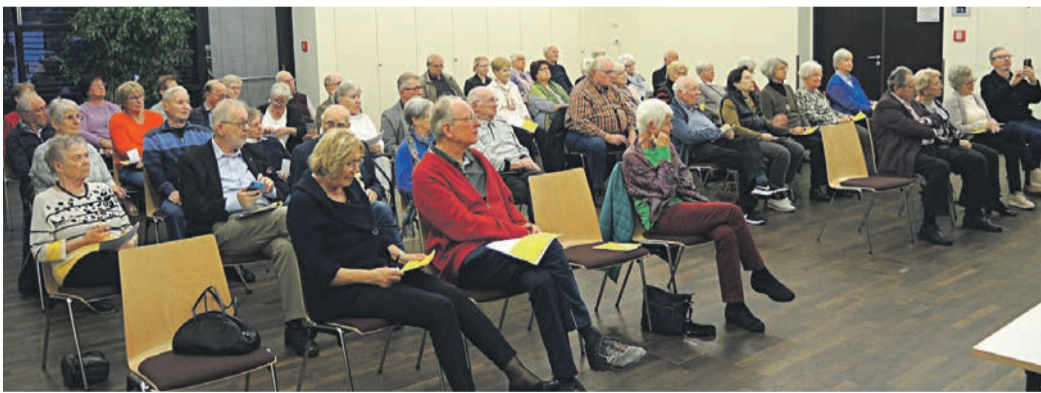
52 Mitglieder nahmen an der Jahreshauptversammlung teil.