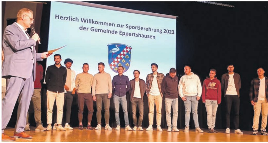
Die erste Mannschaft des FVE wurde A-Liga Meister und schaffte dieses Jahr den Aufstieg.