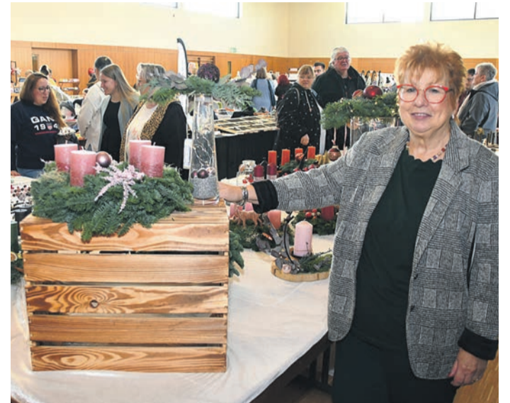
Die 30. Schau mit Verkauf der Hobby-Künstler Eppertshausen zog am Wochenende Hunderte in die Bürgerhalle.

Eppertshausen (jedö) Ihren Vereinsnamen tragen die Hobby-Künstler Eppertshausen einerseits zu Recht, andererseits spiegelt er nicht ihre ganze Herkunft wider. 30 Kreative gehören dem in Eppertshausen registrierten Verein an, doch nur drei, vier davon wohnen selbst in der Gemeinde. Am Zusammenhalt der in der ganzen Region lebenden Künstler ändert dies wenig: Seit nunmehr zehn Jahren existiert der e. V. - und die Ausstellung am Samstag und Sonntag in der Eppertshäuser Bürgerhalle war schon die 30. (!) ihrer Art. Ob es am Jubiläum oder am Wachstum der Veranstaltung in den vergangenen Jahren lag oder einfach nur daran, dass sich die Künstler und ihr Ereignis in Eppertshausen und dem