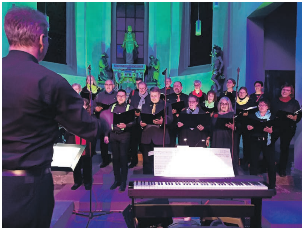
Nach fünf Jahren lud der Kirchenchor St. Sebastian zum musikalischen Event und wusste bei jedem Werk zu überzeugen.