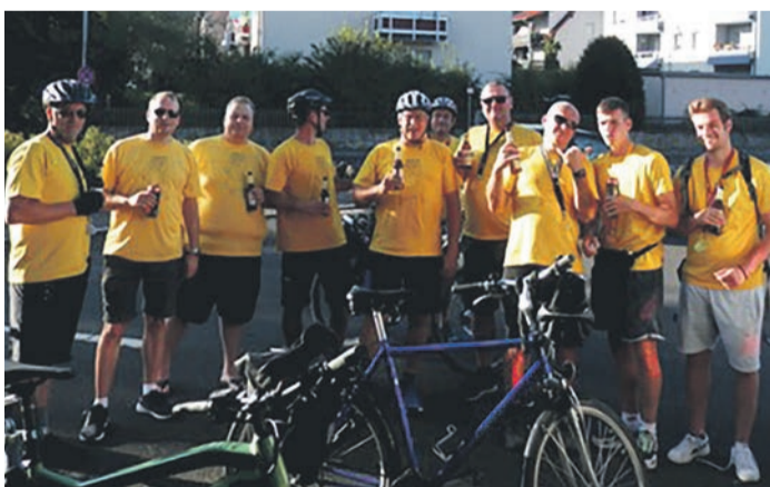
TAV Männerballett „Dumm Sau“ auf Rad-Tour

Eppertshausen (EA) Die diesjährige Radtour führte die Eppertshäuser Tänzer und Kartenspieler nach Mittelhessen. Nach der Übernachtung im beschaulichen Bad Orb konnte man mit dem Vulkanexpress-Bus viele Höhenmeter gewinnen, die man anschließend auf einem Teil des südlichen Bahnradweges entspannt bergab fuhr. Unterwegs wurde man mehrfach unverhofft mittels eines Versorgungsfahrzeugs mit kühlen Getränken erfrischt. Den Abend verbrachte man in Gelnhausen bei gutem Essen, Kartenspiel, Knobeln und Würfeln. Am Sonntag fuhr man bei bestem Radlerwetter über Kahl und Seligenstadt nach Hause. Die erfahrenen Mitglieder freuten sich besonders, dass auch ein Nachwuchsspieler die Strapazen der Tour auf sich nahm.