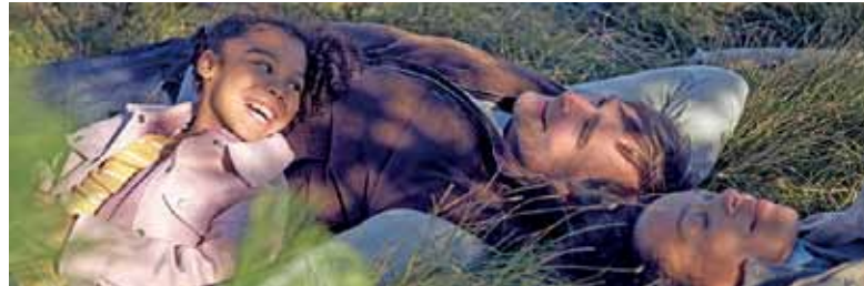
Chance und Risiko immer gut abwägen: Am besten für die finanzielle Vorsorge ist ein breites Portfolio, das die nötige Sicherheit bietet und trotzdem einen guten Ertrag erwirtschaftet.

(DJD-K). Der Ukraine-Krieg und andere politische Brandherde, die Bedrohung durch den Klimawandel und die drohende Krise der Rentenversicherung, wenn die Babyboomer in den Ruhestand wechseln: Die Menschen in Deutschland müssen sich auf schwierige Zeiten einstellen, gerade in finanzieller Hinsicht. Eine im März 2023 durchgeführte Mentefactum-Umfrage im Auftrag der R+V Versicherung wollte wissen, wie die Bürger ihre Zukunft und ihre eigene Vorsorge beurteilen. Hier sind vier zentrale Ergebnisse: