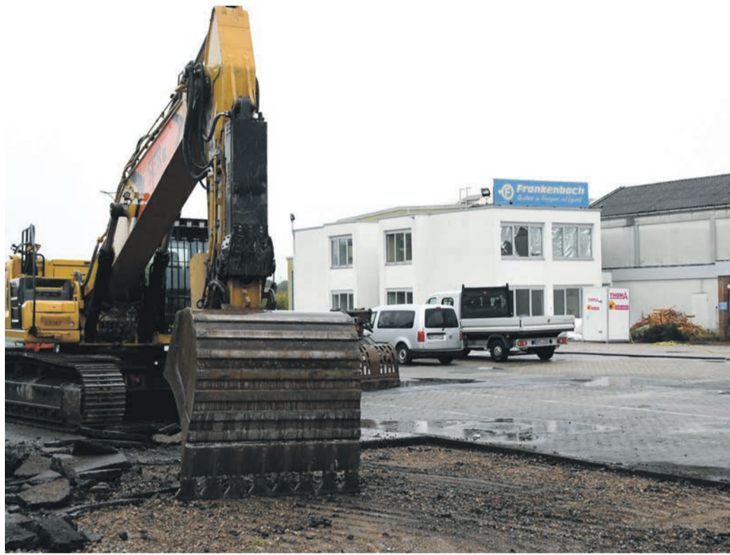
Der Abriss der Gebäude und der Abbruch der versiegelten Flächen auf dem Frankenbach-Gelände im Münsterer Südwesten kostet die Gemeinde 900.000 Euro.

Frankenbach-Gelände: Wie berichtet, läuft auf dem Gewerbeareal im Münsterer Südwesten der Abriss der Bestandsgebäude. Dort soll ein neues, reines Gewerbegebiet entstehen. Bis Ende des Jahres sollen der Abbruch der Immobilien und der versiegelten Flächen abgeschlossen sein. Nun nannte Schledt die Auftragssumme: Der Abriss kostet die Gemeinde, die bei der Entwicklung der Fläche mit der Hessischen Landgesellschaft kooperiert, rund 900.000 Euro. Nach dem Abriss erfolgt eine Bodenbehebung, durch die geklärt werden soll, ob ein Austausch des Bodens erforderlich wird. Auch auf Kampfmit-