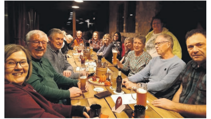
Einige Unentwegte des AGV traten den Fußmarsch Richtung Langfeldsmühle in Hergershausen an, wo sie nach einigen technischen Zwischenstopps auch wohlbehalten ankamen. Dort erwartete sie der Rest der Gruppe und man hatte gemeinsam einen sehr gemütlichen Abend, der nach einigen Stunden wieder mit dem Fußmarsch und natürlich im Regen Richtung Münster endete.