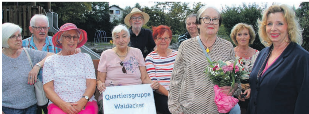
Ehrenamtler, Eltern und Kinder – alle profitieren von diesem Projekt - da sind sich die Beteiligten

Rödermark (NHR) Da sind auf der einen Seite Großeltern, die ihre Enkel nur selten sehen können, weil die eigenen Kinder weit weg wohnen. Oder auch Menschen der Generation 55 plus, die selbst (noch) keine Enkel haben, aber Freude am Umgang mit Kindern. Auf der anderen Seite Eltern, die sich freuen, wenn ein älterer Mensch für ihre Kinder die Rolle von Oma oder Opa übernimmt, weil die eigenen Eltern nicht greifbar sind. Beide Seiten bringt seit Herbst 2017 in Rödermark das Projekt „Wunschgroßeltern“ zusammen. Aufgelegt wurde es vom Ortsverband des Kinderschutzbundes und dem städtischen Ehrenamtsbüro, die bis heute bei der Organisation kooperieren. „In diesem generationsübergreifenden Ehrenamt engagieren sich junggebliebene aktive Ältere mit positiver Lebenseinstellung, die Verantwortung übernehmen möchten“, berichtet Ute Schmidt, die Leiterin des Ehrenamtsbüros. „Und diese wichtigen ehrenamtlichen Helferinnen und Helfer werden auch dringend benötigt.“ Denn: In Rödermark leben viele zugezogene Familien, die hier keinen Familienanschluss haben, sich für ihre