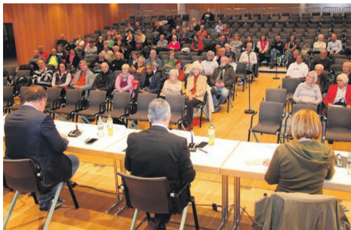
Die an die Bürgerversammlung anschließende Fragestunde stand vor allem im Zeichen von Verkehrsthemen

Die Parksituation in einem Wohngebiet, mehr Kontrollen, Verkehrslärm, die viel diskutierte Kreisellösung für die Kipferl-Kreuzung, Raser in Waldacker, Radwege, die Notwendigkeit von Straßensanierungen, die missliche Hängepartie für die Anwohner nach der nicht ordnungsgemäß ausgeführten Sanierung der Dockendorffstraße, die Straßenreinigungspflicht, außerdem eine missglückte Bienenwiese am Bahnhof Urberach, durstige Bäume, die Umgestaltung des Parks am Entenweiher, Photovoltaikanlagen auf öffentlichen Gebäuden – darum ging es in den Fragen, die zur Sitzung eingereicht worden waren, und auch in den Beiträgen am Saalmikrofon. Bürgermeister Jörg Rotter und Erste Stadträtin antworteten ausführlich, gaben Hintergrundinformationen und Hinweise zu Rechtsvorschriften, die beachtet werden müssen, was den Bürgern oft aber nicht bewusst ist. Kindergärten müssten keine laubfreien Zonen sein, Blühflächen auf den Friedhöfen könnten die Besucher erfreuen, Spielplätze müssten nicht Golfplätzen ähneln, das sogenannte „Straßenbegleitgrün“ nicht alle