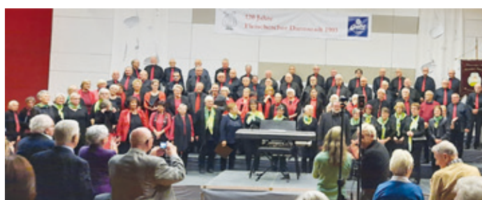
Schlussbild aller Chöre

Gesangverein Eintracht 1870 e.V. zu Gast beim Fleischerchor-Jubiläum