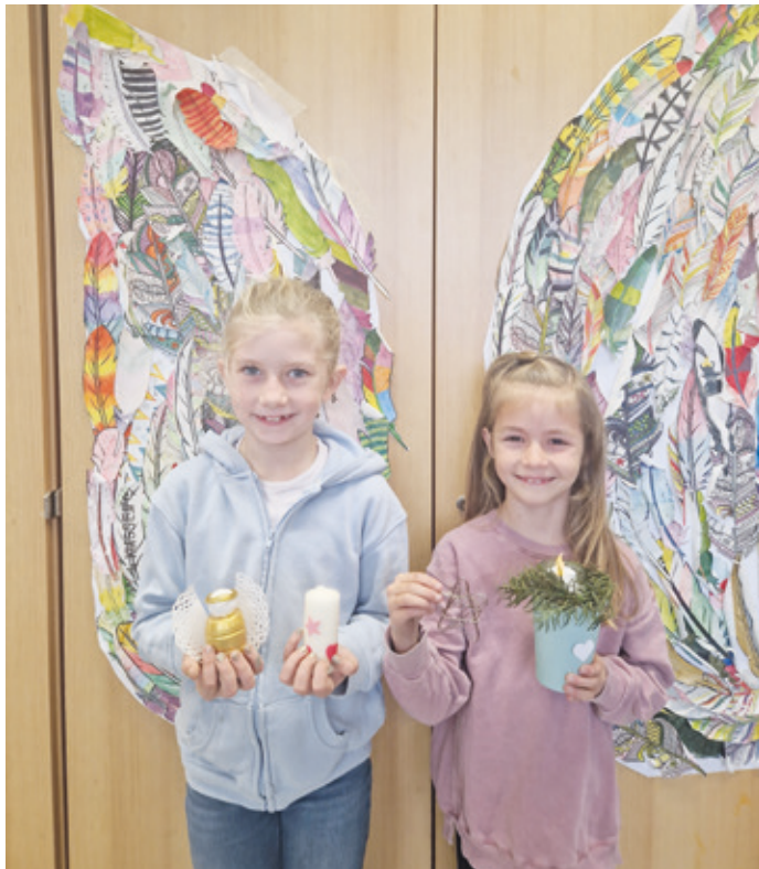
Das eingenommene Geld wird der Grundschule und damit den Kindern der GAZ zugutekommen.

Eingeladen sind neben der Schulgemeinschaft auch alle Interessierten und Weihnachtsbegeisterten, die die Schule schon oder wieder einmal besuchen möchten.