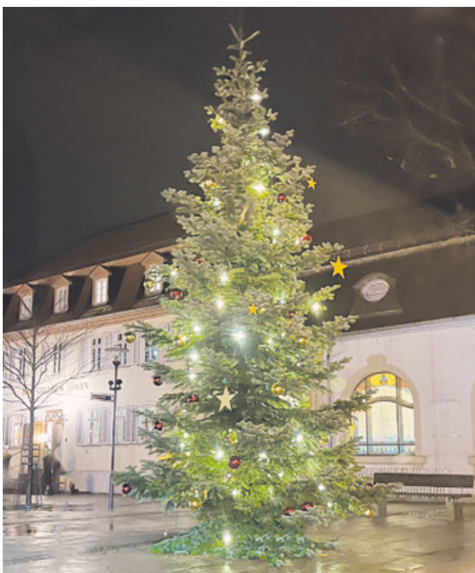
Wir bedanken uns herzlich bei der Firma Auto Brust GmbH, die uns, den Gewerbeverein Arheilgen e.V., so tatkräftig beim Aufstellen des Weihnachtsbaums unterstützt haben.