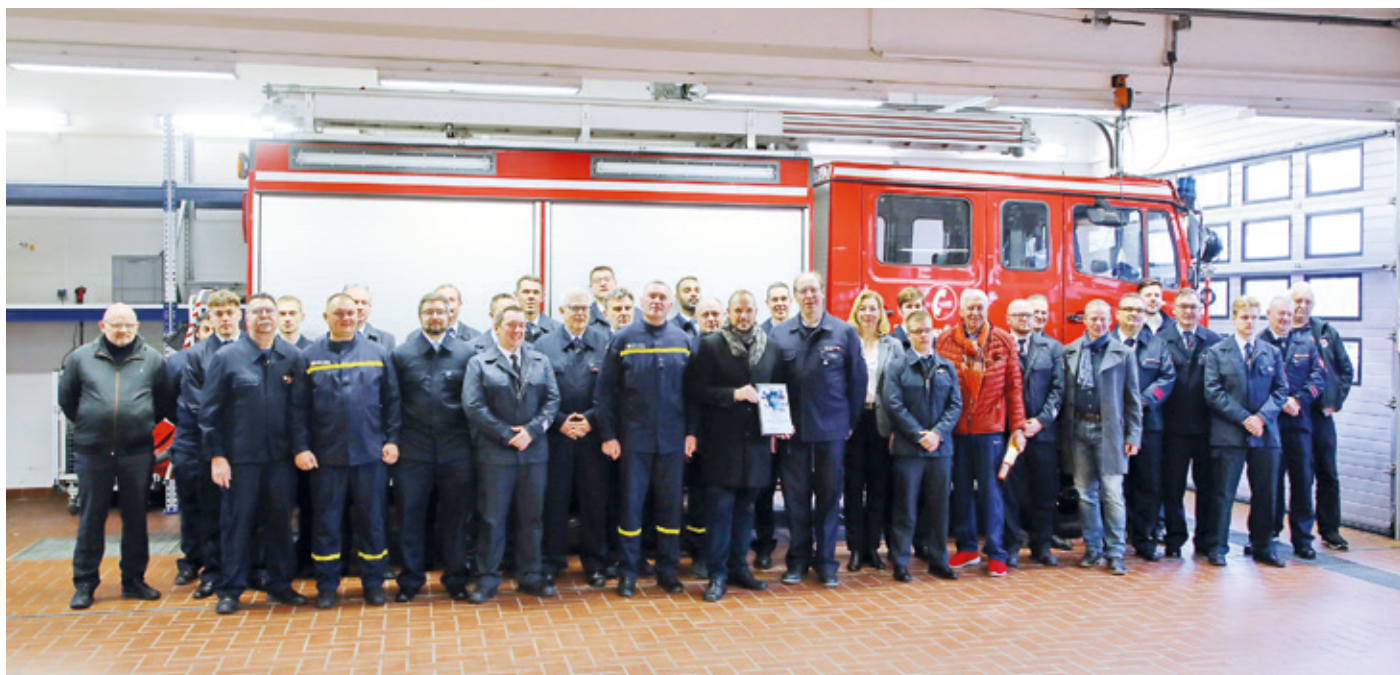
Gruppenbild mit den Feuerwehrkameraden aus Ivanychi vor dem gespendeten TLF 16/25.