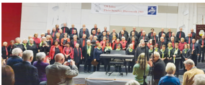
Schlussbild aller Chöre

Gesangverein Eintracht 1870 e.V. zu Gast beim Fleischerchor-Jubiläum