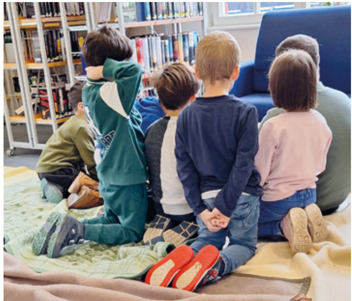
Foto: Vorschulkinder der Kita Kiefernweg beim Bundesweiten Vorlesetag in der Bücherei

Je einen Exemplarsatz der von der Sparkassen-Kulturstiftung zur Verfügung gestellten Bücher spenden wir an die Schulbibliothek der Lessingschule und der Hessenwaldschule.